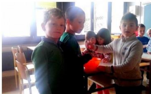
Dela pešiva v podsljapanem biavnju