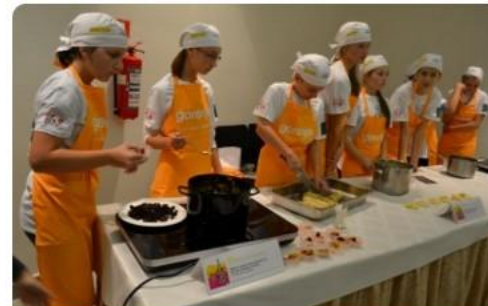
8. festival kulinarike v GH Union

Prosimo vse starše, ki opazite uši pri svojem otroku, da nemudoma pričnete z odpravljanjem uši, otroka zadržite doma in nas o tem obvestite.