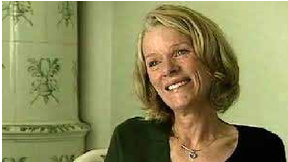
Ur "Min kamp mot tiden".

Och samtidigt som boken spreds sattes de sista klippen i tv-programmet "Min kamp mot tiden", en tims lång dokumentär som hon själv tog initiativet till och aktivt var med om att utforma. Hon hann också se – och ge sitt godkännande av – slutversionen. Men samma dag som programmet skulle sändas, den 10 mars 2004, orkade hennes kropp inte längre. På förmiddagen avled hon, hemma, omgiven av sina närmaste, så som hon själv hade önskat. Samma kväll visades filmen i tv som planerat – också det i enlighet med hennes egen vilja.