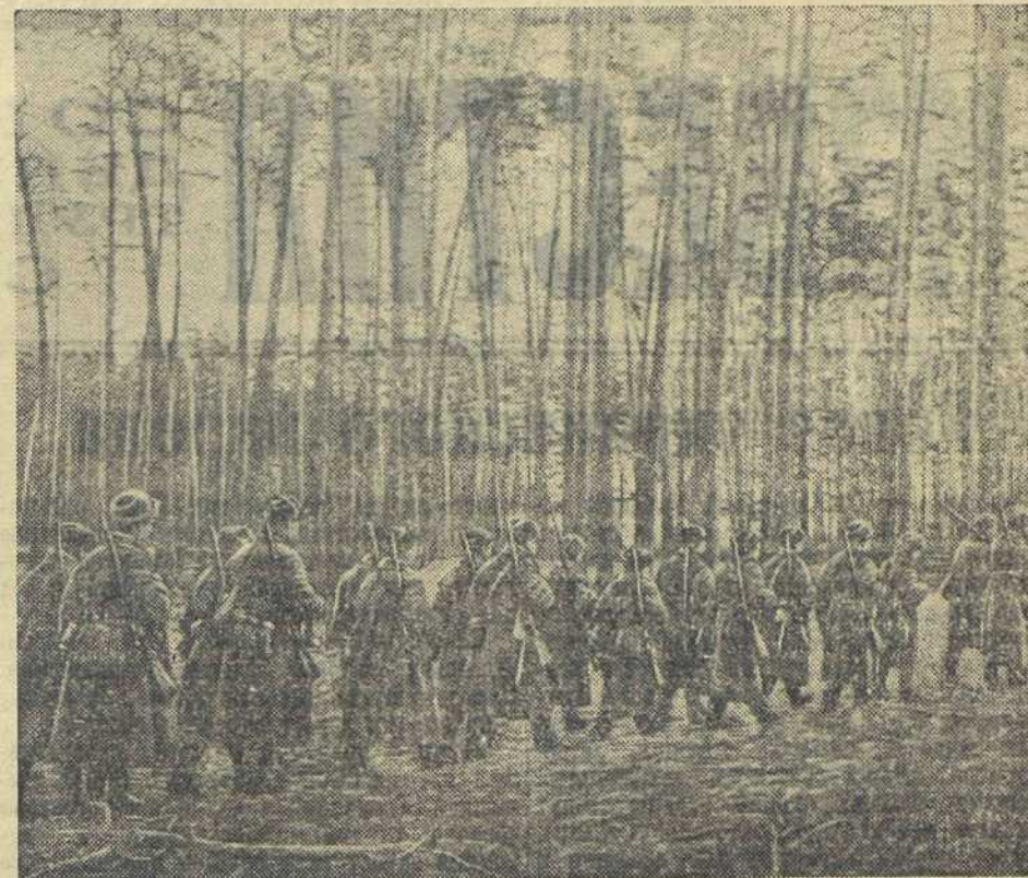
НА ЗАЩИТУ МОСКВЫ. Н-ский рабочий полк, сформированный из трудящихся города, выходит на предначинанное ему место.

Принято 26 ноября 1941 г. на митинге представителей украинского народа.