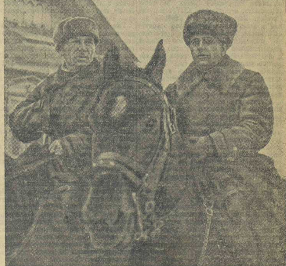
Командир 3-й гвардейской кавалерийской дивизии генерал-майор И. А. Плиев (слева) и командир 2-го гвардейского кавалерийского корпуса генерал-майор Л. М. Доватор.