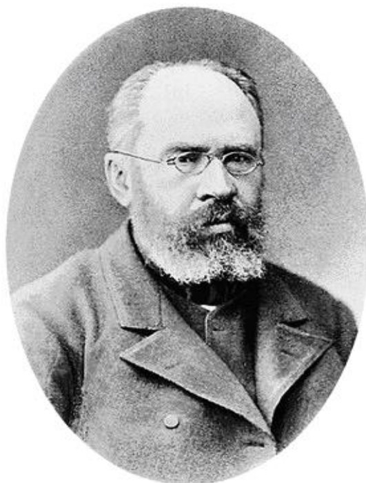
Пётр Иванович Бартенеv (1829–1912)