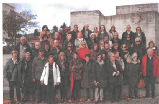
Grupo de visitantes