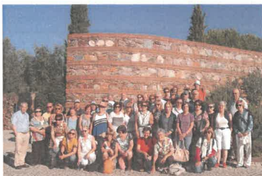
Grupo de visitantes