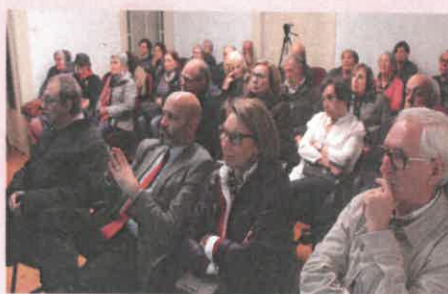
Uma assistência atenta

Ser velho é só ter mais idade, ter vivido mais, ter mais coisas para dizer.