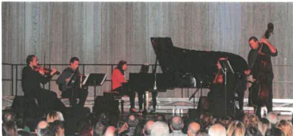
O grupo Quintetango, interpretando Astor Piazzolla