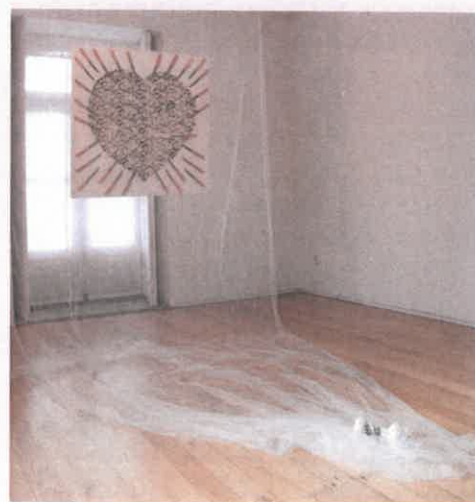
"O Pesadelo" (As Vítimas da Violência Doméstica)

Nesta visita à UPP, que teve como objectivo o conhecimento directo do CDI - Centro de Documentação e Informação sobre o Movimento Operário e Popular do Porto (que comemora 20 anos em 2021), foi possível mostrar parte do seu acervo e conversar sobre as experiências de trabalho nesta temática.