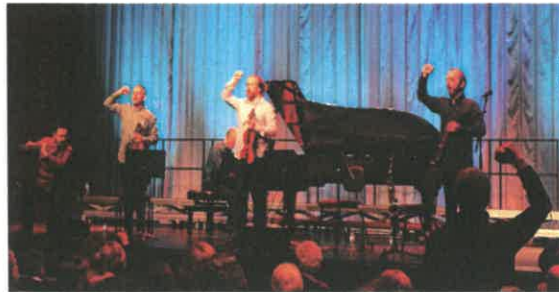
O grupo Música com Paredes de Vidro, lembrando o Chile com "O Povo Unido Jamais Será Vencido"