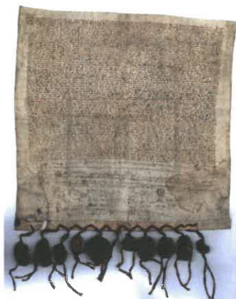
Auto de Aclamação de D. João I