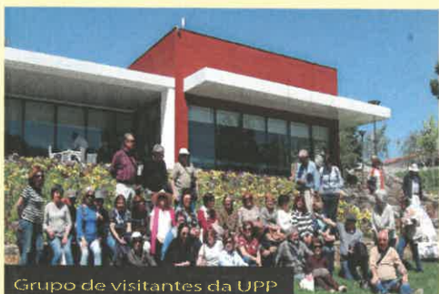
Grupo de visitantes da UPP

No segundo dia iniciou-se a atividade com a divisão do grupo em dois, para que, enquanto