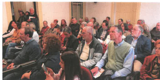
A sala principal da UPP foi pequena, tendo-se recorrido à transmissão por vídeo para outra sala