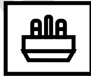
الشكل رقم (١)