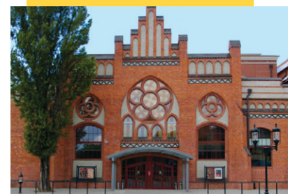
Lukasz Golowanow, CC BY SA 3.0

Während der Konferenz waren überall die Konferenz-T-Shirts mit dem aufgedruckten Motto „Free Knowledge in the City of Freedom“ (Freies Wissen in der Stadt der Freiheit) zu sehen: So drückte Wikimedia die Verbindung ihrer Grundwerte mit der Geschichte der Stadt Gdańsk (Danzig) aus, in der die Solidarność-Bewegung unter der Führung von Lech Wałęsa in den 80er Jahren das kommunistische Regime stürzte. Wałęsa sendete den Konferenzteilnehmern der Wikimania Grüße und merkte dabei an, dass er selbst häufig Wikipedia nutze.