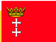
MEDEF, CC BY SA 2.0