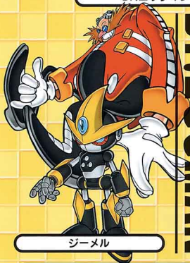
ドクター Dr.エッグマン

“チーズ”という名前 なまえ のチャオ チャオ を連れて つ いるウサギ うさぎ の女の子 おんなのこ 。 甘えん坊 あまなま なところもあるけれど、何事 なにごと にも一所懸 いっしょけん 命 いのち ながんばりやさんで、とても礼儀正 れいぎせい しい。 大きな耳 みみ をはばたかせて空 そら を飛ぶこともできる。