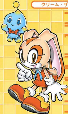
クリーム・ザ・ラビット