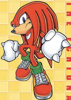
ナックルズ・ザ・エキドゥナ