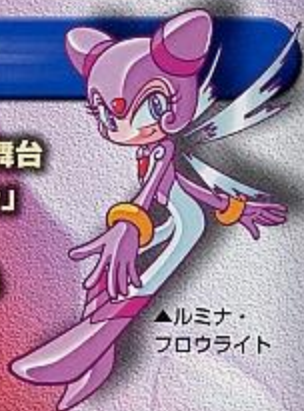
▲ルミナ・ フロウライト

マージナリワールドは 様々な次元世界の人々の 夢や希望がつむぎだす結晶体「プレシャストーン」という ジュエルの力によって支えられていました。