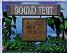
サウンドテスト画面

ゲームに登場するアイテムが見られます。スタートボタンで「HELP」を終了して、メニュー画面に戻ります。各アイテムの説明はP.16をご覧ください。