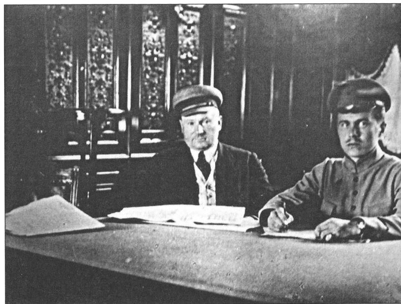
И.И. Вацетис в своем штабе