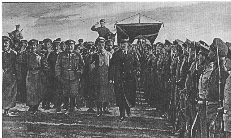
Л.Д. Троцкий и И. И. Вацетис на параде