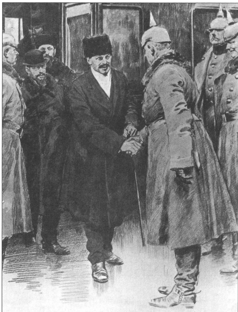
Прибытие в Брест-Литовск российской делегации для подписания мира с Германией