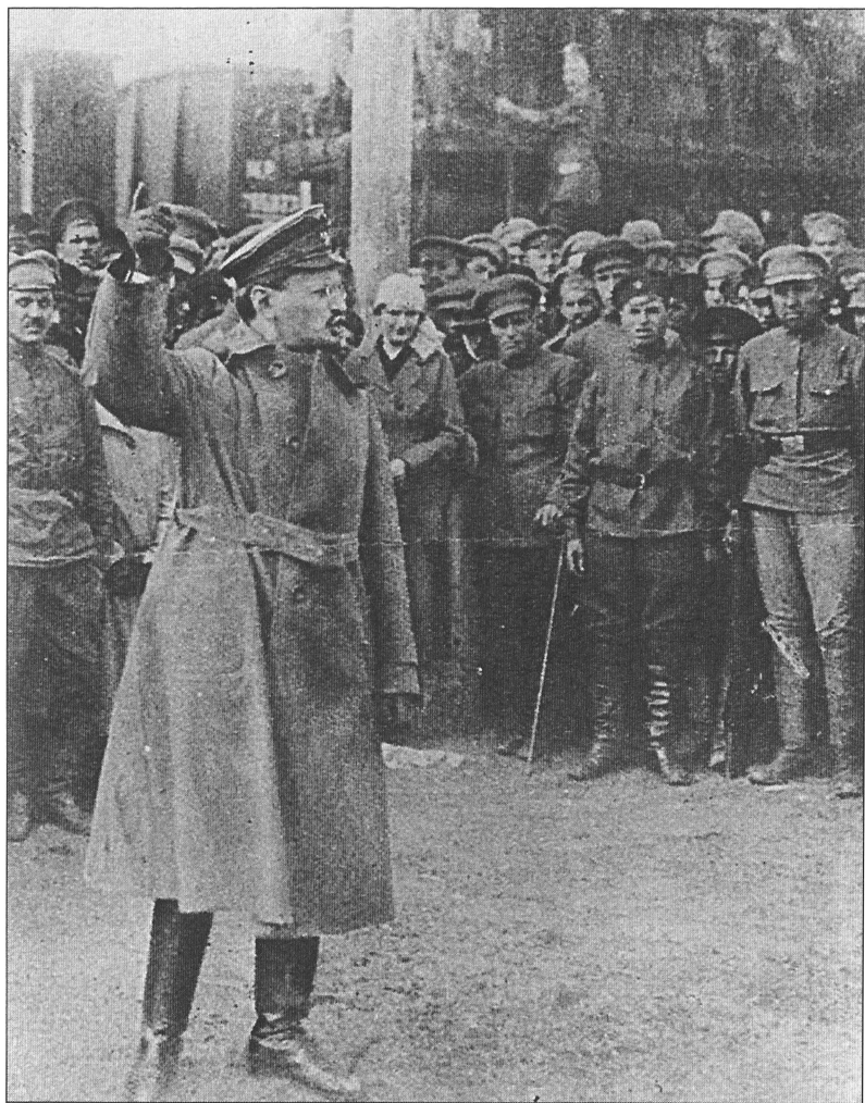
Л.Д. Брежнев выступает перед красноармейцами