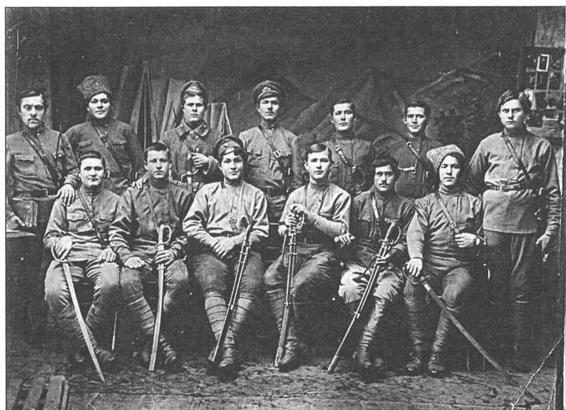
Группа командиров Красной Армии