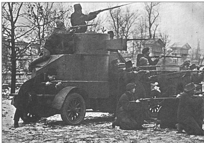
Красногвардейцы у бронеавтомобиля, захваченного у юнкеров