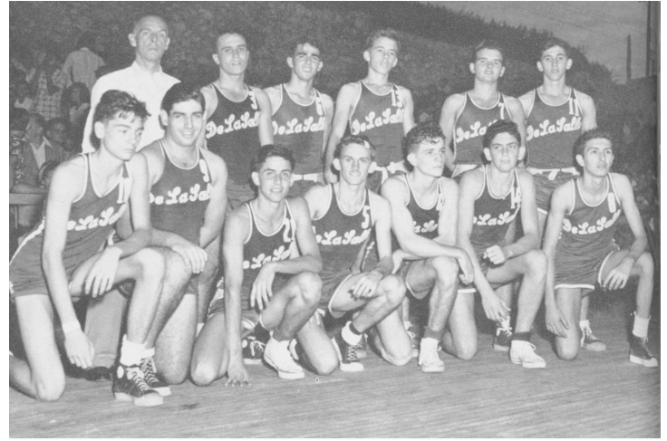
Menores de 18 años - 3er. Lugar 1959