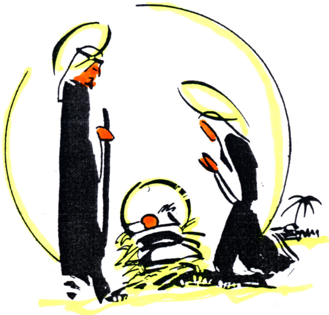
Dibujo original Hno. Fco Malvido, fsc

NON PROFIT ORGANIZATION U.S. POSTAGE PAID MIAMI, FL PERMIT NO. 6091