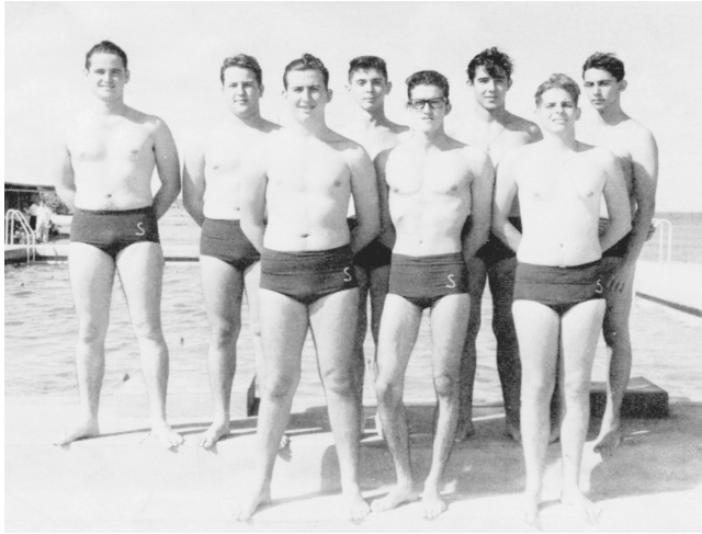
Menores de 18 años - 1er. Lugar 1959