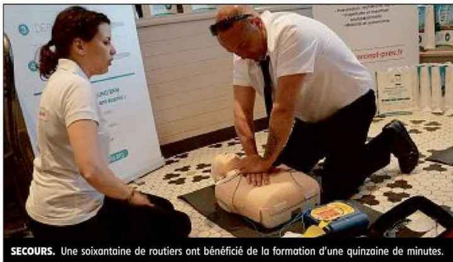
SECOURS. Une soixantaine de routiers ont bénéficié de la formation d'une quinzaine de minutes.