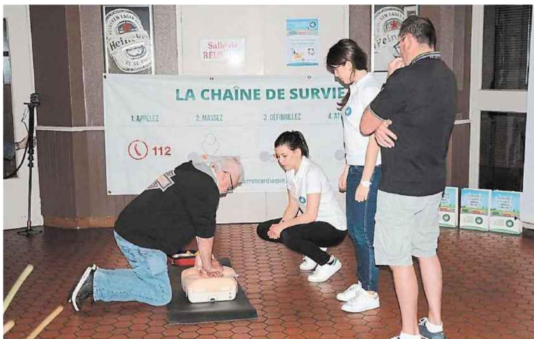
Les chauffeurs routiers ont testé les massages cardiaques et le défibrillateur, mercredi, au relais routier Le Central.