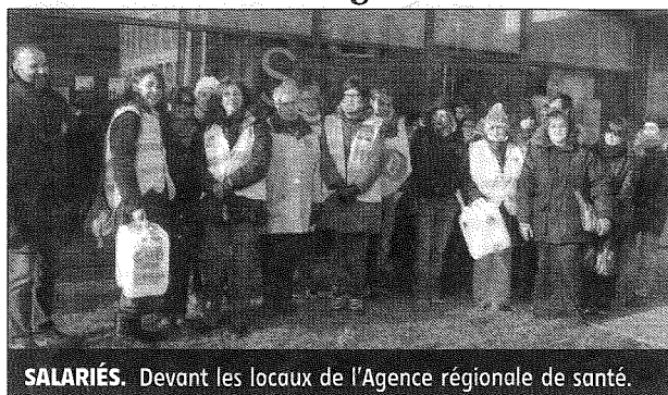
SALARIÉS. Devant les locaux de l'Agence régionale de santé.