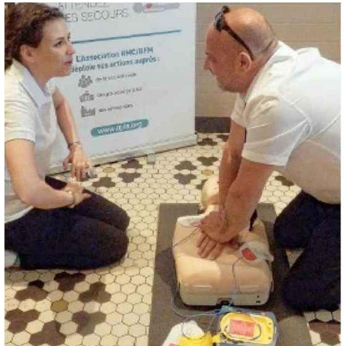
Un chauffeur-routier a effectué une mise en situation : il a réalisé un massage cardiaque sur un et a utilisé un défibrillateur.