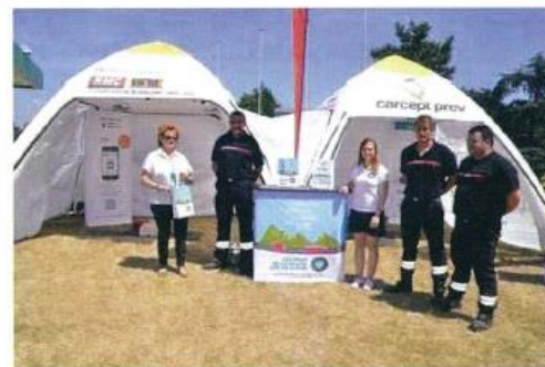
Les différents acteurs de la journée sur l'aire d'autoroute. les acteurs de la journée

aux démonstrations de l'utilisation du défibrillateur automatique, ont rappelé la chaîne de survie : 4 minutes, 4 gestes, 1: appeler (ne pas oublier de situer sa position) le 18, le 15 ou le 112 ; 2 : masser (la victime doit être allongée sur le dos sur un plan dur) ; 3: dès l'arrivée du défibrillateur automatisé externe (DAE) ouvrez-le, mettre en place les électrodes sur le thorax de la victime à même la peau en suivant les instructions d'utilisation vocales ; 4 : attendez les secours.