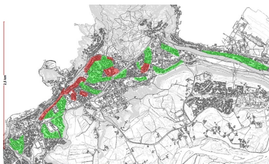
1Kartutsnittet over viser fornyingsområder i grønt, og områder som ikke skal fortettes i rødt. (Finnes i A3-format som vedlegg til planbeskrivelsen)

Ved utvikling av en del av et fornyingsområde er det viktig at fortettingsprosjektet ikke legger hindringer for å kunne utvikle de øvrige deler av området til samme tetthetsgrad.