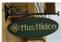
Uthengsskilt er godt synlige for forbipasserende i gågata. Gir også et ryddig uttrykk.

1.9 Det er ønskelig at vinduer skal fremstå som vinduer. Skilt og reklame på vinduer skal derfor begrenses i omfang og utstrekning, og skal aldri dekke mer enn ¼ av vinduet. Skilt og reklame på vindusflater skal oppfylle de estetiske retningslinjene på lik linje med annen skilting. Skiftende vindusutstilling omfattes ikke av disse vedtektene.