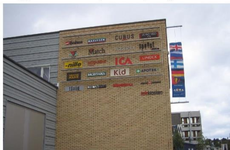
Oversiktlig og godt lesbart samleskilt.

1.6 Virksomheter mot gågate og torg kan ha et uthengsskilt. 1 Dette skal ha en høyde på 40 cm og en lengde på 100 cm. Dersom uthengsskilt benyttes andre steder innad i kommunen gjelder samme regler for størrelse og plassering, jfr. §2.4.