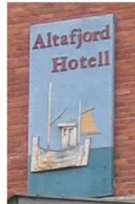
Eksempel på skilt som representerer kreativitet og gode detaljer.