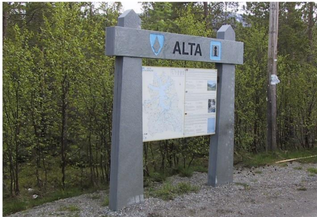
Infoskiltet er utført i materialer og farger tilpasset det omkringliggende miljøet.