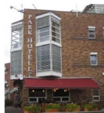
Et vellykket eksempel på at det i enkelte tilfeller kan være aktuelt med en alternativ plassering.