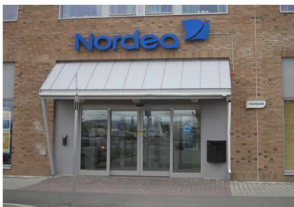
Skilt utformet som utskårne bokstaver og symboler. Det er pent, lett leselig og tar hensyn til fasaden. Skiltet markerer inngangen.