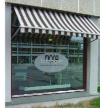
Markisen er godt tilpasset bygget, og reklamen er plassert på vinduet i stedet for på markisen