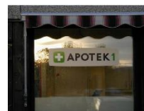
Pent, dempet, men likevel veldig beskrivende vindusskilt.