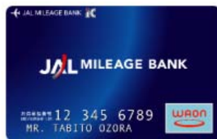
< JMB WAON >