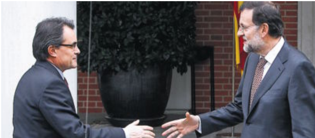
Artur Mas i Mariano Rajoy al Palau de la Moncloa.

Si així és com van les coses, les pretensions de centralitat del PP català s'evaporen. En realitat, vist des de CiU, no pot ser més que el braç local d'un vast mecanisme d'estrangulament polític i econòmic del qual no