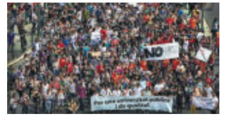
Protesta universitària a València.

saben com alliberar-se, però amb el qual no vénen gens de ganes de col·laborar. Queda per veure què pot pensar de tot això la ciutadania, que de moment només veu que la seua qualitat de vida es deteriora cada dia. Si això els passa factura, ja que governen, uns l'Estat i els altres Catalunya, serà una de les poques coses que, ara com ara, el PP i CiU poden tindre en comú.