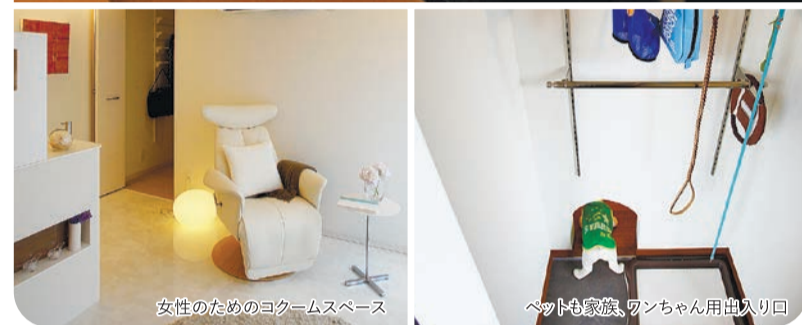
女性のためのコクームスペース