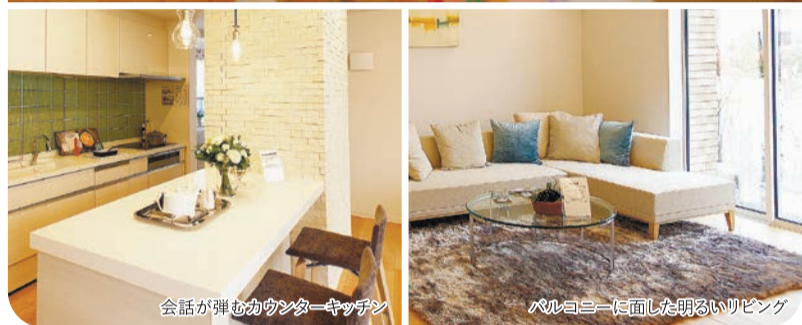
会話が弾むカウンターキッチン