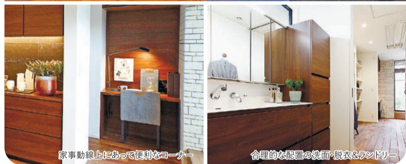
家事動線上にあって便利なコーナー