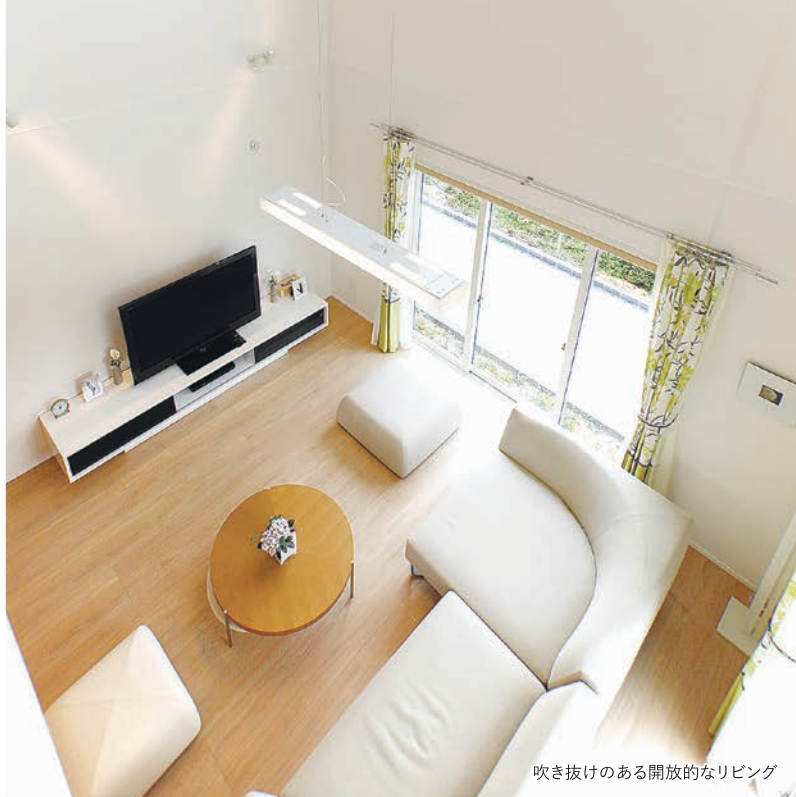
吹き抜けのある開放的なリビング