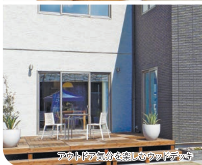
アウトドア気分を楽しめろウッドデッキ