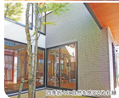
四季折々に自然を感じぬれ縁