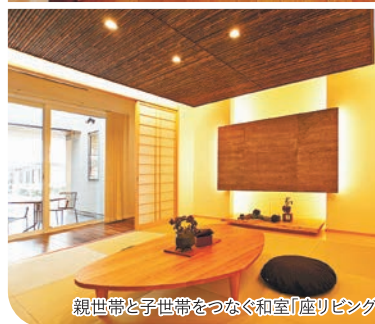
親世帯と子世帯をつなぐ和室「座りリビング」