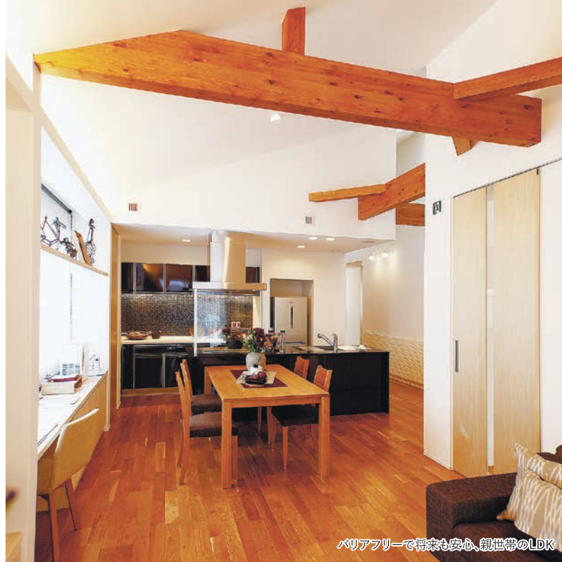
バリアフリーで将来も安心、親世帯のLDK