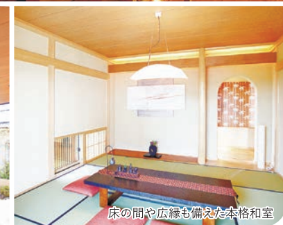
床の間や広縁も備えた本格和室

落ち着いた和風の外観に加えて、室内のヒノキの柱やしっくい壁も本格的で素晴らしい。それでいて、アイランドキッチンや吹き抜けのあるダイニングといった大胆さもマッチしている。家族3世代で、時には親戚や友人を招いてにぎやかに食事やだんらんを楽しみたいものです。