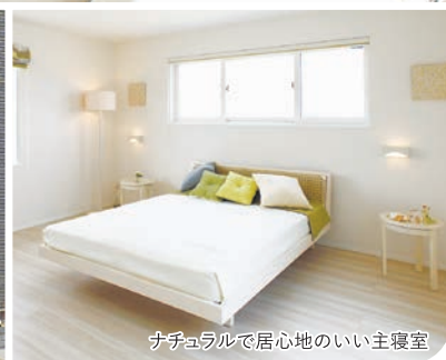
ナチュラルで居心地のいい主寝室

親世帯・子世帯それぞれにLDKがあるから、お互いの生活リズムを尊重し合えていいね。1階と2階をつなぐ吹き抜け越しに、「晩ご飯、一緒にどう?」「おいしいお菓子があるからお茶にしましょう」なんて声掛け合ったりして。こんなマイホームなら子どもたちも喜びそうね。