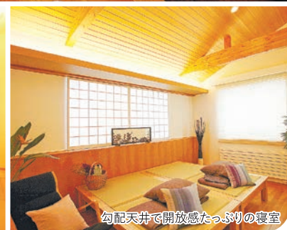
勾配天井で開放感たっぷりな寝室

親世帯と子世帯が和室を挟んで左右に分かれているなんてグッドアイデア。お互いの生活音が気にならない、真ん中の和室を共用できるのもいいわ。私たちのLDKや寝室は、広さも配置もちょうどよく、バリアフリーで将来も安心。毎日のことだから、使い勝手がいいのが一番ね。