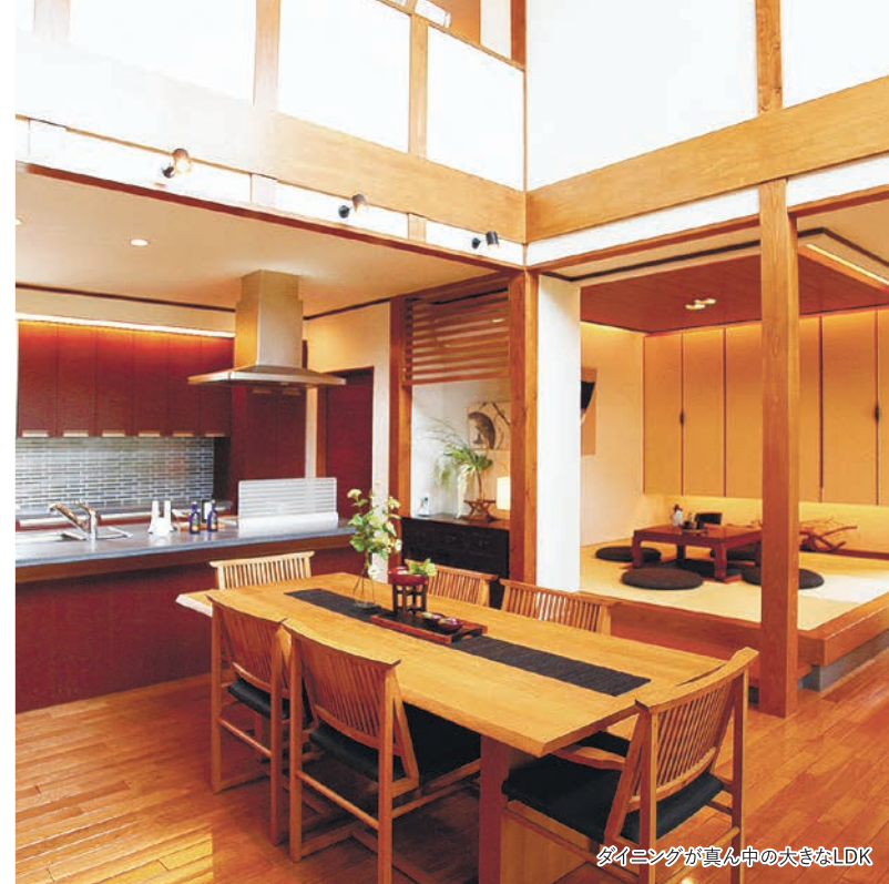
ダイニングが真ん中の大きなLDK