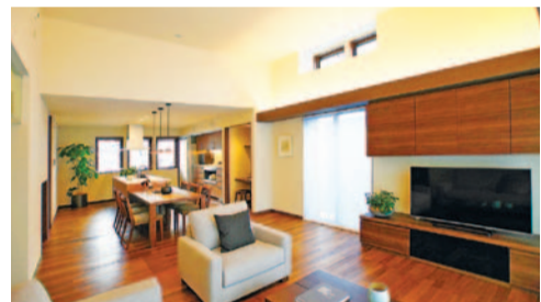
14 GENIUS UD二世帯(木質パネル接着工法) 東北ミサワホーム TEL.023-633-0330

最近、天井の高い住宅が増えています。その中でも3.5mは、群を抜く高さ。この開放感は気持ちまで大らかにしてくれるはず。さあ、ソファに座って天井を見上げ、家族との豊かな時間を想像してみてください。