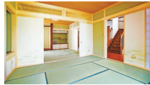
18 木造軸組工法 ウッドホーム TEL.023-687-1742

最近ではあまり見られなくなった二間続き和室のご提案です。しかも、床柱付き床の間や仏間、書院までしつらえた本格派。親戚付き合いを大切に、人の集まる機会の多い山形の生活スタイルにぴったりだと思いませんか。