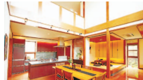
12 骨太百年の家「和の館」(新木造ストロング工法) 日本ハウスHD 日本ハウス事業部 TEL.023-624-1187

アイランドキッチンに明るいダイニング。家族の時間もホームパーティーも「食」を真ん中に盛り上がるように、中央にダイニングを配したLDKです。大きな吹き抜けからは光が降り注ぎ、2階との間に一体感も生まれます。