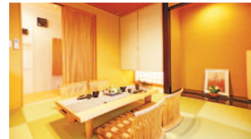
13 良質住宅(木造軸組工法[ISL工法]) イシカワ TEL.023-679-4445

シラス壁に風情のある建具でモダンな印象の和室だから、リビングとの続き間としても違和感なく調和。改まった来客には建具を閉め切って落ち着いた和のおもてなしを。扉の開け閉めで雰囲気の違いを確かめてみてください。