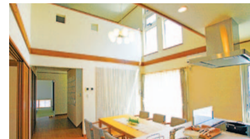
15 JS-Basic Type V(木造軸組[J・エポック工法]) 日本ハウスHD J・エポックホーム事業部 TEL.023-615-0290

お客さまをお迎えするリビングとは一線を画した、ファミリー重視のダイニングキッチン。吹き抜け越しに2階ホールや主寝室とつながり、コミュニケーションは良好。キッチンと2階に分かれて会話を楽しんでみませんか。