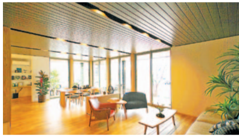
17 ザ・グラヴィス(木造軸組工法[シャーウッドFSMJ工法]) 積水ハウス シャーウッド展示場 TEL.023-626-5001

サッシを開放すればリビング・ダイニングとの一体感が生まれる広々ウッドデッキ。深い庇が強い日差しや雨から守ってくれます。休日には自然に家族が集まる空間。四季折々の過ごし方のイメージが膨らみます。