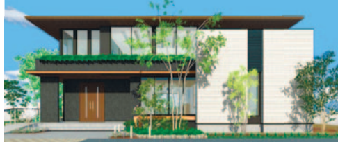
11 The Forest BF 住友林業 TEL.0120-576-675

落ち着いた色合いと水平ラインが印象的な外観フォルム。理想的な2世帯住宅をご提案いたします。