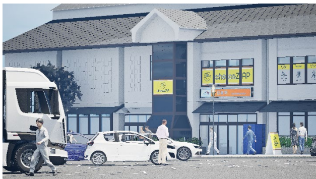
■日本平 PA(上り)の店舗イメージ