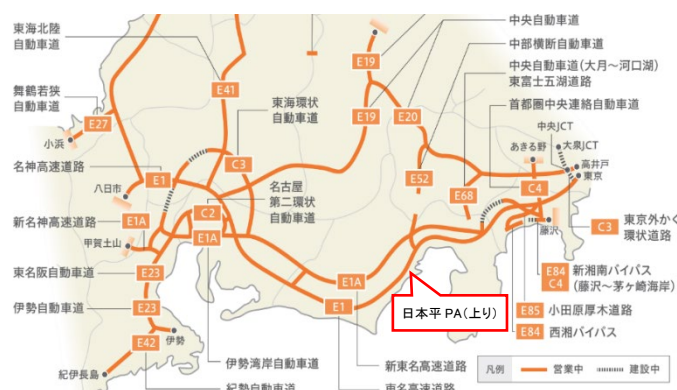
日本平 PA(上り)位置図

※オープン時期や利用料金の詳細については、別途、各社ホームページにてお知らせします。