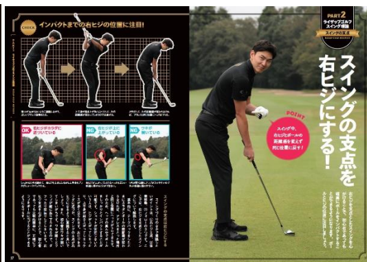
スイングのポイントを写真で徹底解説