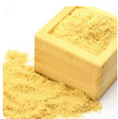
米ぬか発酵エキス ※3