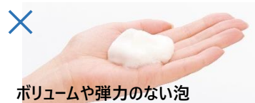
ボリュームや弾力のない泡