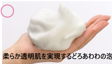
柔らかく透明肌を実現するどろあわわの泡