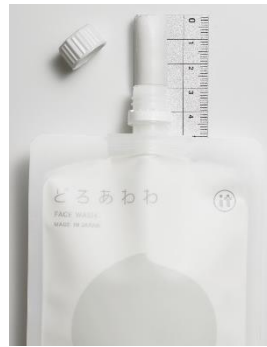
使用目安量 3 c mが重要なポイント