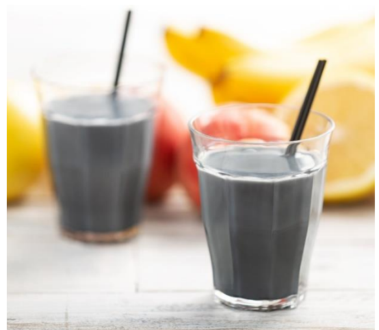
スキのないカラダを目指す「ダイエットフォーミュラ」