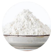
ホホワイトクレイ *4

毛穴やキメに入り込んだしこい汚れなどを根こそぎ吸着。汚れて開いた毛穴もスッキリし、肌をつるんとなめらかに引き締めます。