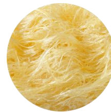
加水分解エラスチン *3

通常のコラーゲンを分解酵素で細かく分子量を小さくした。肌になじみやすく、しっとりなめらかな肌に整えます。