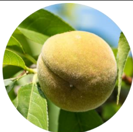
ベビーピーチエキス *3

完熟前の若い桃には、ポリフェノールなどがたっぷり。国産の早摘み桃を手積みし抽出した希少エキスを配合。