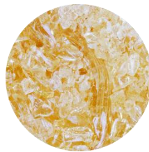
加水分解コラーゲン *3

通常のコラーゲンを分解酵素で細かく分子量を小さくした。肌になじみやすく、しっとりなめらかな肌に整えます。