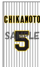
この他にも魅力的な画像をプリインストール予定