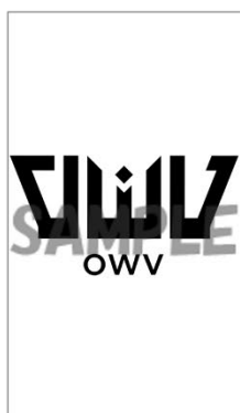
こちらの画像を 転送したイメージ