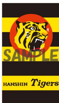
こちらの画像を 転送したイメージ