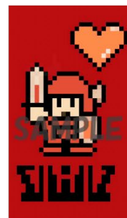
この他にも魅力的な画像をプリインストール予定