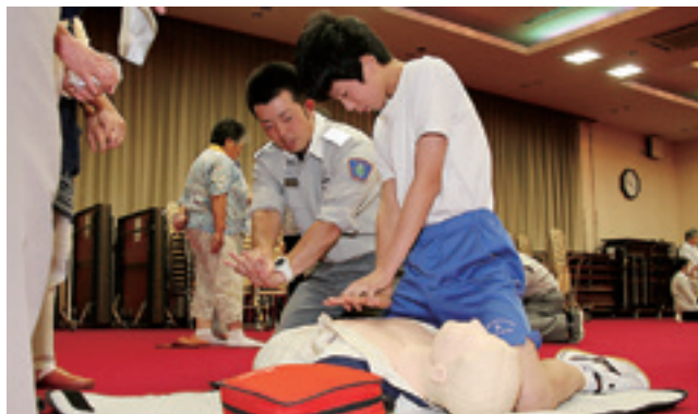
指導を受けながら一次救命処置の手順を確認しました