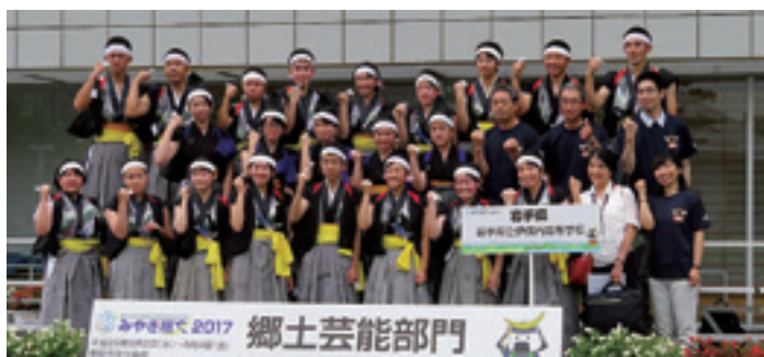
全国高文祭での優良賞に輝いた伊保内高等学校郷土芸能委員会

村をはじめとする、多くの皆さまからいただいた温かい支援と、朝早くから会場に駆け付けての熱い声援に心から感謝申し上げます。