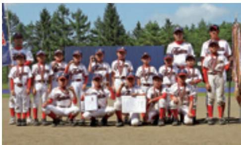
投打がかみ合い優勝に輝いた戸田ファイターズ

村少年野球選手権大会は8月5日にナインズ球場で行われ、戸田ファイターズが優勝に輝きました。大会には村内から江刺家ロビンズと銀杏クラブ、伊保内スポーツ少年団、戸田ファイターズの4チームが出場。