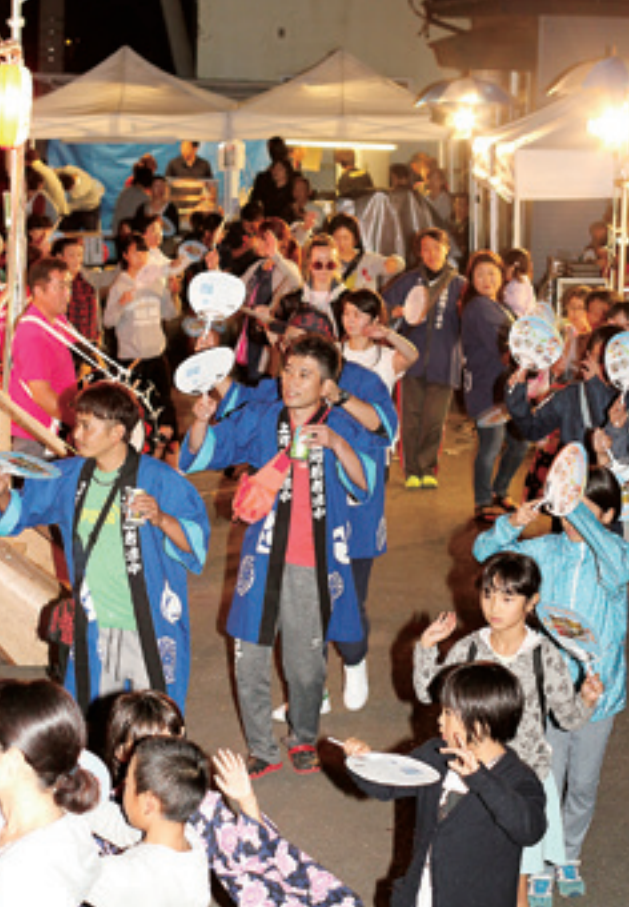
声を弾ませて輪踊りを楽しむ来場者たち