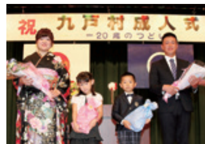
園児から新成人へ花束が贈呈