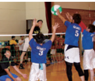
鋭いスパイクに 素早いブロックで反応