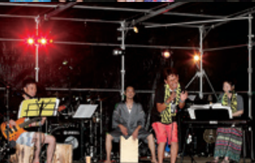
熱いライブステージを披露したWare House