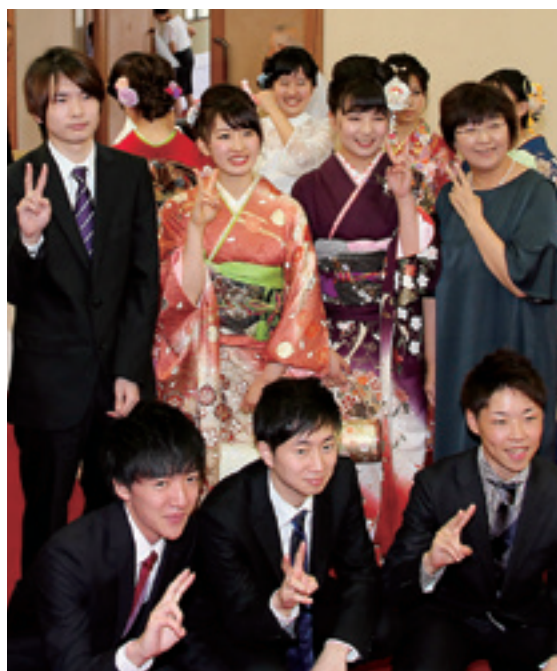
新たな門出を祝う新成人たち

し新成人を祝福。いと嬉しい笑顔で新成人2人に花束を手渡していました。 式典後は、新成人がステージに上がり、 はたち 二十歳宣言を発表。現在の近況や、今後の抱負、将来の目標や夢を力強く宣言していました。式に出席した新成人を紹介します。(敬称略)