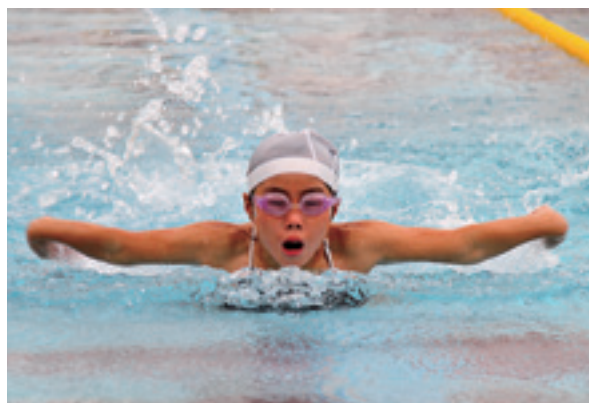
躍動する泳ぎで果敢に攻める選手