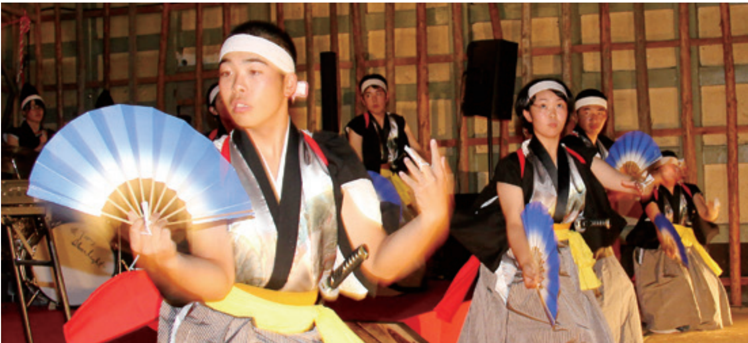
マッシューズさんの奏でる世界と融合する、伊保内高等学校郷土芸能委員会の江刺家神楽

た伝統の舞と、世界を魅了してきた、マッシューズのピアノが夢の共演を果たす。郷土愛の精神が継承されてきた伝統の神楽と、世界の舞台上で活躍し愛されてきたピアノのリズムが、一瞬で滑らかに共鳴した。