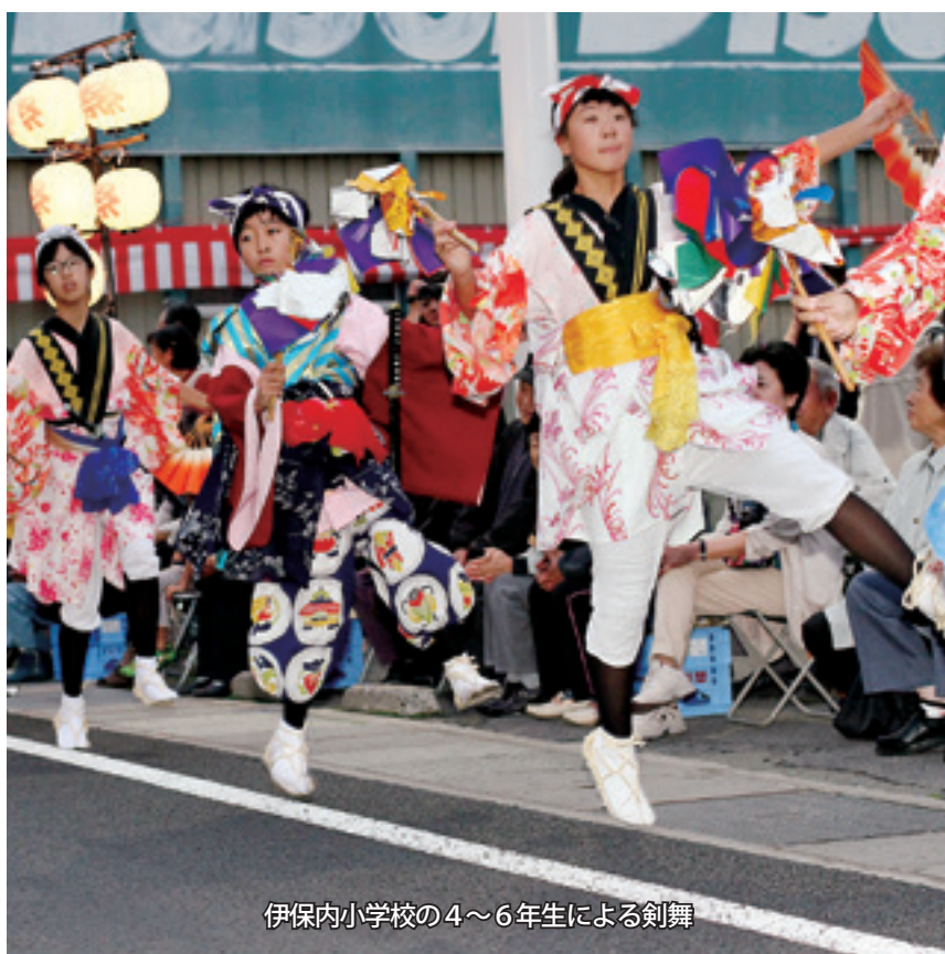
伊保内小学校の4～6年生による剣舞

中日の18日は、村金融団や伊保内高等学校など8団体が参加しての流し踊り。園児から年配の人まで、あでやかな着物に身を包み、音楽に合わせて九戸音頭を