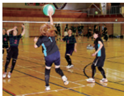
掛け声を掛け合いながらボールを追いかけて、熱戦を展開