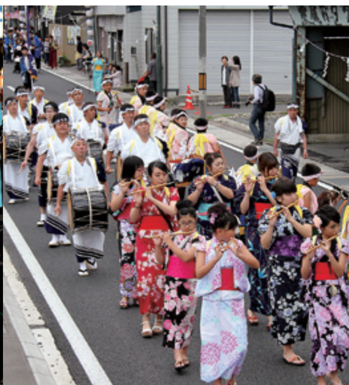
川向駒踊り連合によるおはやし