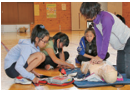
山根小学校での救急救命法講習会

突然目の前で人が倒れたら戸惑ってしまうのは当然です。しかし、救急講習会などで一度経験しておけば、人の命を救うための手助けは誰にでもできることなのです。大切な命を救うため心肺蘇生法やAEDを使用した除細動（電気ショック）を中心とした応急手当を学びましょう。