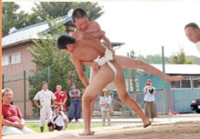
力強いまなざしで相手に立ち向かっていました