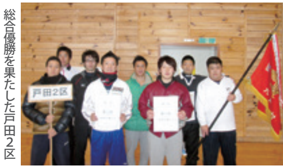
総合優勝を果たした戸田2区

た村民体育大会の総合成績が決まり、本年度は戸田2区が総合優勝に輝きました。村内6つのブロックに分かれ、8種目の合計得点によって順位が競われた村民体育大会。本年度は計46チーム、510名が参加。7月12日の5種目を皮切りに、戸田2区は最初から最後までトップとなり、2年ぶりに栄冠を奪還しました。全種目の競技結果は左下の表の通りです。