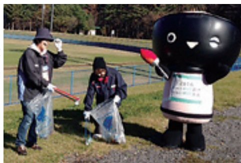
きれいな球場でもてなそうと清掃活動するダスキン二戸の関係者

ダスキン二戸で11月13日、ナインズ球場の清掃活動を行いました。平成28年10月2日にいわて国体軟式野球競技会場となつているナインズ球場において、ダスキン二戸の関係者12名がゴミ拾いを行いました。参加者は「ナインズ球場を訪れたお客様が少しでも気持ちよく国体に参加、応援してくれれば」と話していました。