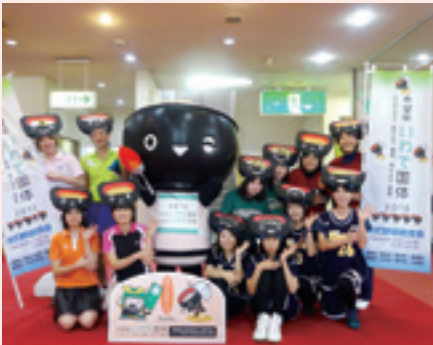
幼稚園と保育園の先生方11月29日・歳末チャリティー演芸会でわんこダンスを披露した後で