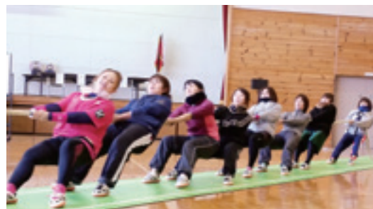
驚異の11連覇を成し遂げた伊保内1区女子