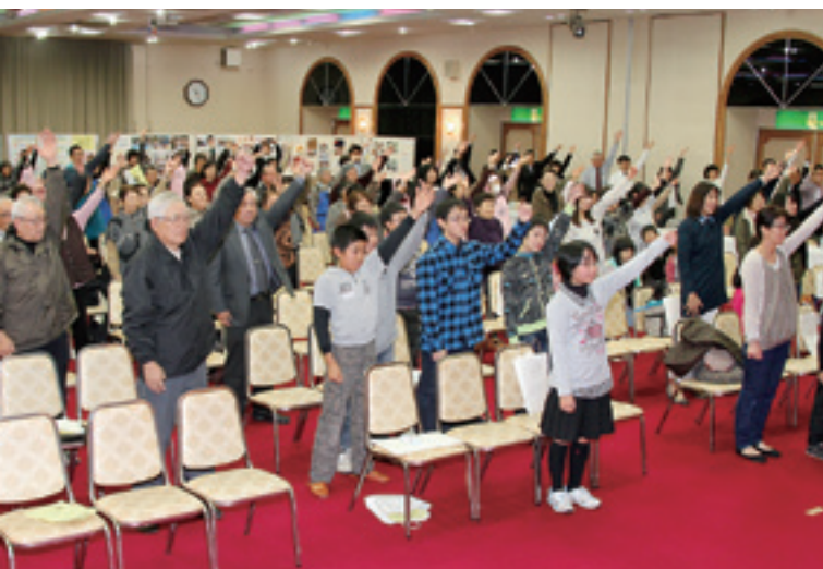
音楽に合わせた健康体操で体をほぐしました