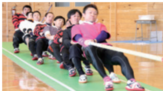
他を圧倒し6連覇を達成した伊保内1区男子

た。競技の結果、伊保内1区が男女とも他を圧倒する強さを発揮し、優勝の栄冠を獲得。伊保内1区は男子が6連覇、女子が11連覇を達成する快挙となりました。