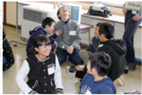
英語を使い、笑顔でコミュニケーションを図る6年生児童

協働学習をし、学校間の交流を深めようとする、ナインズプランが11月20日、伊保内小学校で行われました。村内5つの小学校から5年生51名、6年生49名が集まり協働学習を行いました。外国語の学習を行った6年生は、音楽に合わせて英語で自己紹介や自分の行きたい国を紹介。児童たちは楽しそうにコミュニケーションを図っていました。