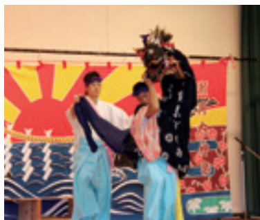
伝統の雄姿を披露した、瀬月内神楽保存会