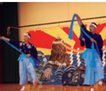
軽やかな神楽演舞をした、九戸神楽保存会