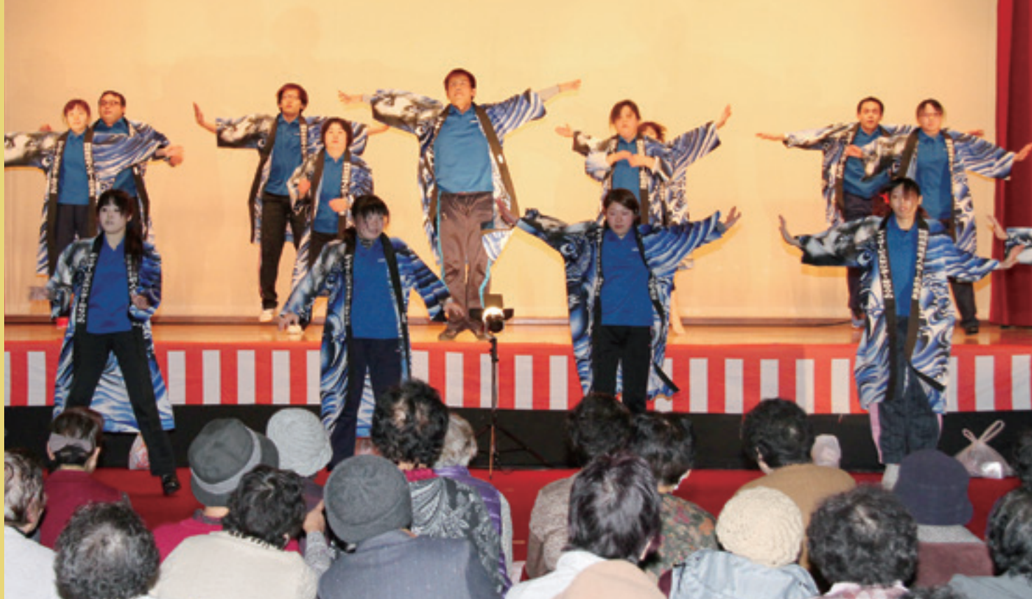
九戸福祉会親睦会が元気いっぱいに迫力ある南中ソーラン節を披露