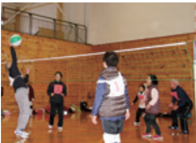
老若男女誰でも楽しめるビーチボール