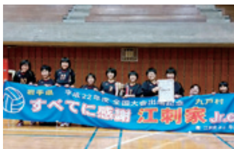
女子2部で優勝した江刺家ジュニアクラブ

いわて純情りんご杯・県小学生バレーボール育成大会は12月5日と6日、奥州市総合体育館などで行われ、江刺家ジュニアクラブが女子2部で優勝を果たしました。本村から3チームを含む、県内男女94チームが