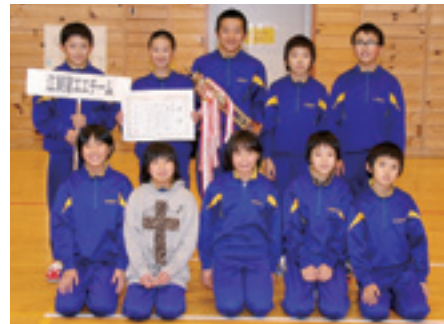
優勝した江刺家エエチーム