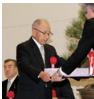
村勢発展の功労者を表彰