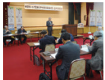
国体準備の本格化に向け10項目の計画を審議した常任委員会

常任委員会では、今年5月の総会で審議された国体開催推進総合計画に基づいた広報や村民協働計画など開催準備の基本となる計画