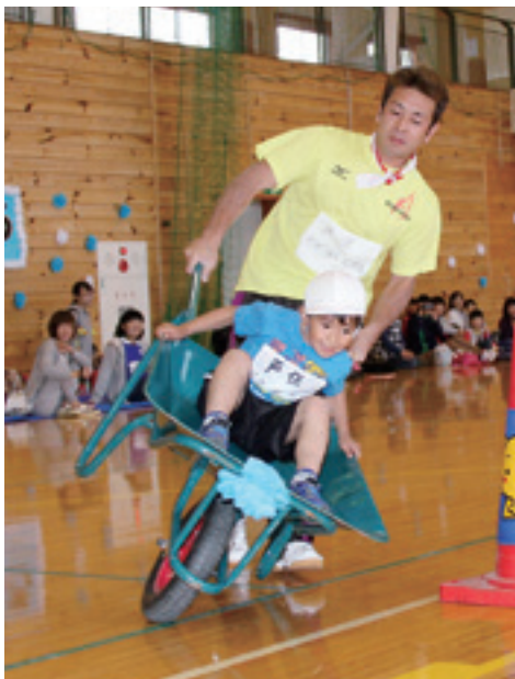
昨年の年長児親子運動会

平成28年度の村内保育園と幼稚園の入園申し込みの受け付けを次の通り行います。お子さんの入園を希望する人は、関係書類を持参して申し込んでください。