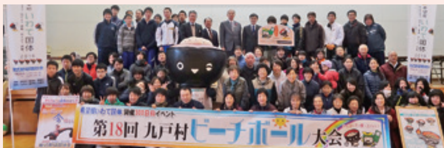
第18回九戸村ビーチボール大会

ビーチボール大会参加者の皆さん12月6日・準備運動としてわんこダンスを踊った後で