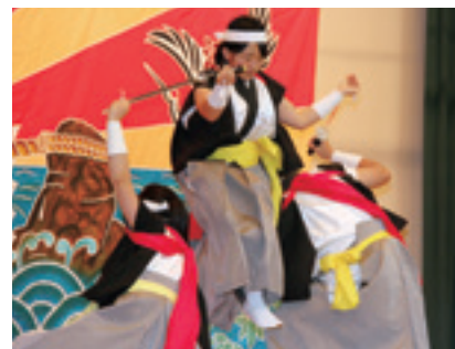
勇躍した舞を披露してくれた、伊保内高等学校郷土芸能委員会