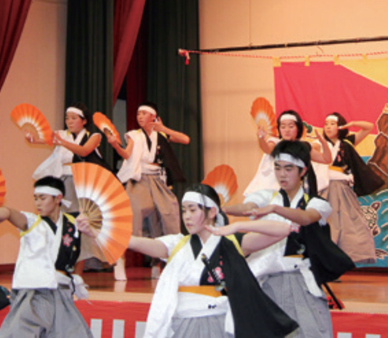
を披露した九戸中学校3年生23名

九戸の山伏神楽祭典が12月6日、HOZホールで行われました。今年は村内5団体を含む9団体が参加。九戸中学校3年生23名は江刺家神楽を演舞。1年前から練習してきた注連切り舞や三宝荒神などを力強く演じてくれました。村内からは他に瀬月内神楽保存会や伊保内高等学校郷土芸能委員会、江刺家神楽保存会、九戸神楽保存会が出演。今まで伝えられてきた伝承芸能の技と魂を見せてくれました。受け継がれてきた勇姿が披露されると、集まった観衆からは大きな拍手が送られていました。