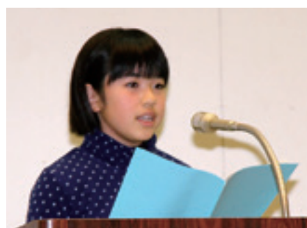
最優秀賞の受賞者が発表

村では、これからの九戸村を担っていく児童生徒の「ふるさと九戸」への郷土愛の醸成と今後の村政運営への参考とするため、村合