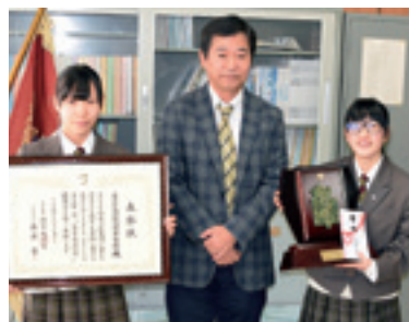
時事通信社から教育奨励賞・優秀賞が贈呈

上位から3番目となる優良賞に本校が選ばれ、表彰状と盾、副賞が贈られました。本校の受賞は、36年目を迎える「九戸村地域子ど