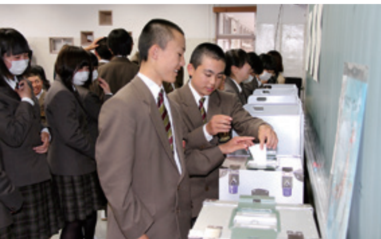
投票用紙に記入し模擬投票を体験する、伊保内高校の生徒