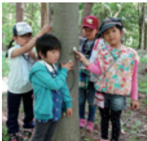
樹木の音を聴く塾生たち