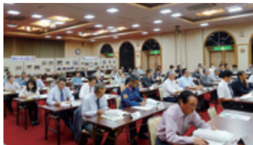
第3回総会で平成27年度事業を審議する実行委員

外野フェンスとバックスクリーンの塗装、安全面確保のためのラバー敷設などを内容とするナインズ球場の改修工事を行うことが報告されました。