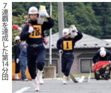
7連覇を達成した第14分団