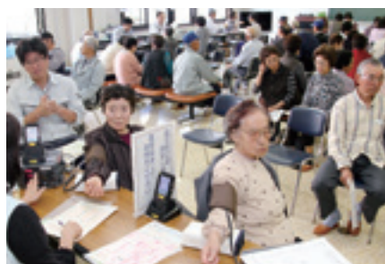
昨年度の特定健診の様子

40歳から74歳までの国保加入者が対象です。病院で治療中の人・定期的に検査をしている人も対象となりますので受診しましょう。