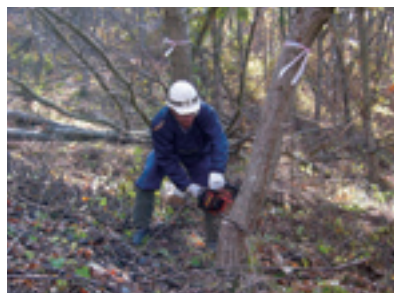
伐採するときは届出を

森林を伐採、開発するには、自分の所有する森林でも事前に届出や許可申請の各種手続きが必要となりますので、計画がありましたら連絡ください。なお、伐採する際は30日～90日前までに役場農林建設課へ届け