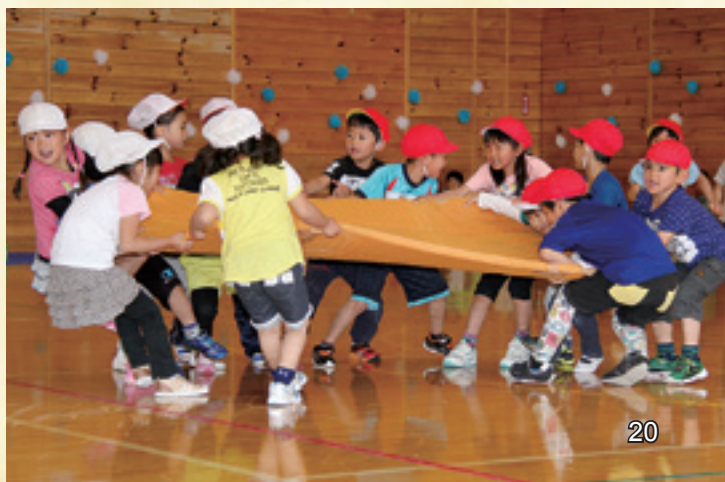
協力して力いっぱい引っ張る、マットとり合戦