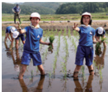
上手に植えてる途中、記念に一枚