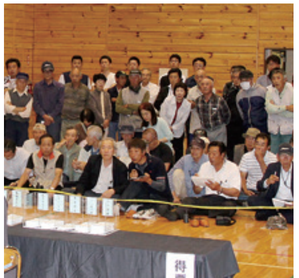
開票結果を見守る多くの参観人

①農業 ②豊かな自然と子ども達 ③入院できる病院の復活 ④一生懸命 ⑤公約実現のため全力でがんばります。