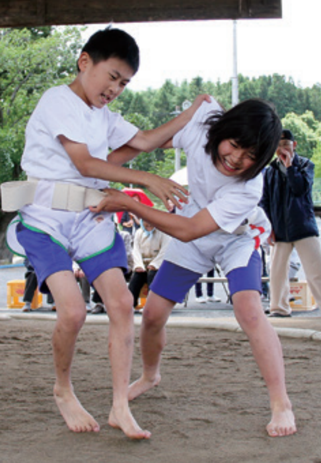
一生懸命相撲に取り組む長興寺小学校の児童