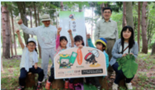
九曜塾で=5月30日、コロポックルランド