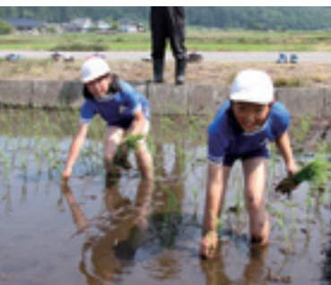
足を取られながらも丁寧に植えました