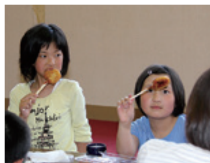
田植えの後は、さなぶり会で餅などを食べお祝いしました