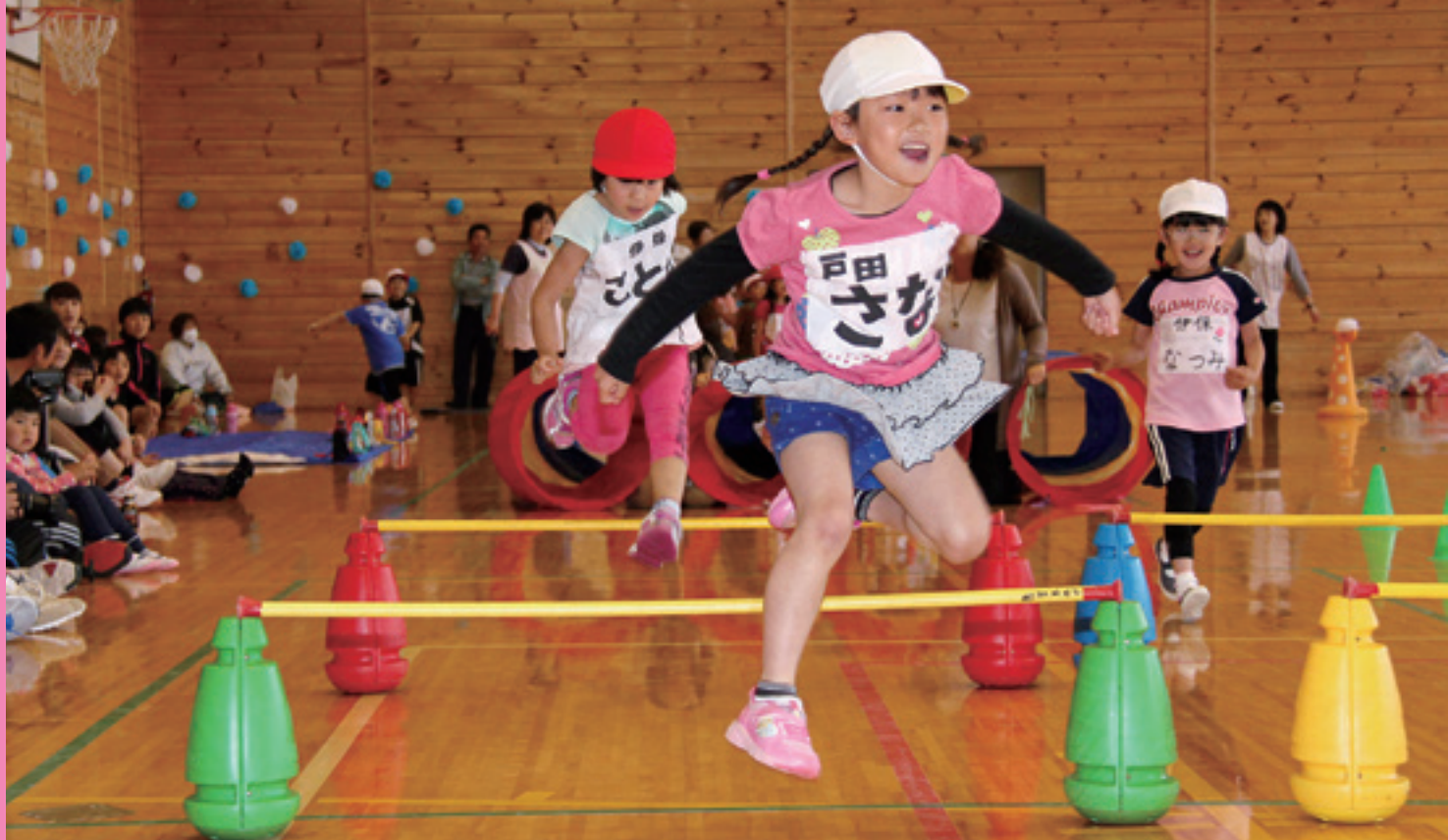
全園児が参加した障害物競走で、元気に駆け跳ねる園児たち