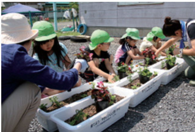
元気に育つことを願いながら花を植える園児たち

折爪岳振興協議会は6月6日、折爪岳において山開きを行いました。濃い霧に包まれた悪天候の中、神事が執り行われた後、植樹祭が開かれました。本村から江刺家自然愛護少年団育成会と荒谷森林愛護少年団の児童も参加し、ツツジやオオヤマザクラの苗を植えました。児童たちは折爪岳が花で彩られることを願いながら丁寧に植樹をしました。この日は、村山友会による山菜の鶏汁も無料で振る舞われ、参加者は舌鼓を打っていました。