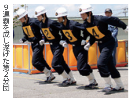
9連覇を成し遂げた第2分団