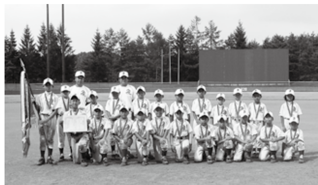
2年連続の優勝を果たした伊保内スポーツ少年団