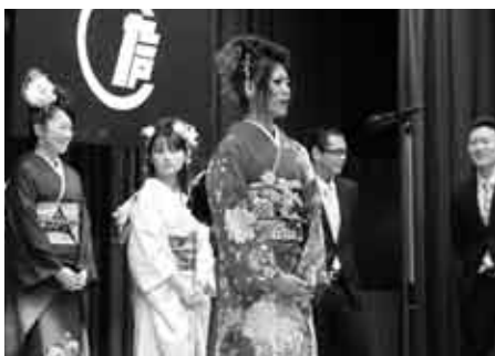
成人を迎えるの抱負を発表しました