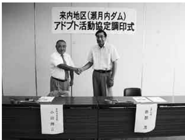
調印式で握手を交わす小田自治会長(左)と岩部村長