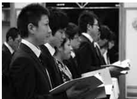
村民憲章を朗読する新成人の皆さん