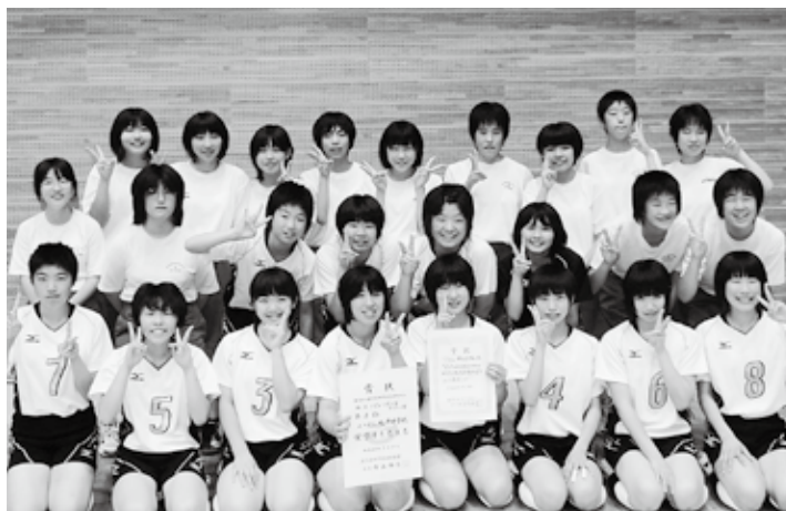
平成23年度県中学校総合体育大会

※優勝・準優勝を果たしたこれらの競技のほか、柔道男子・女子と相撲競技で県大会に出場しました。