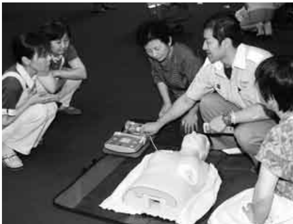
講習会では、AED を使っての心肺蘇生法を学びました