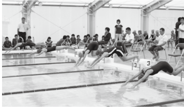
仲間からの声援を受けてレースに臨む選手たち