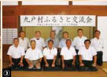
①ふるさとを離れ、首都圏で生活する参加者の皆さんから近況報告が行われました。②華やかな舞で交流会に花を添えた江刺家神楽保存会の皆さん。③楽しい時間はあっという間。会の最後には参加者全員で記念撮影を行いました。