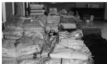
開発センターに集まった救援物資