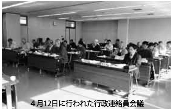
4月12日に行われた行政連絡員会議

【主な活用法】 ▽地域行事への協力▽部落総会資料などの作成▽地域から行政に対しての要望事項など担当機関への取り次ぎ