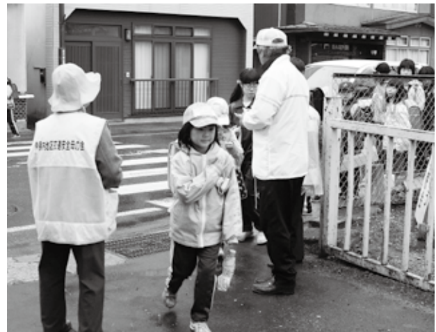
伊保内小学校校門前で黄色い羽根が配布されました

村交通安全対策協議会による黄色い羽の配布は4月11日、各小学校の校門前で行われました。交通安全協会や母の会の皆さんは、「車に気をつけて歩いてね」などと呼びかけながら、登校してくる児童一人ひとりに黄色い羽根を配布していました。また、各小学校や九戸中学校では、駐在所の警察官や村交通安全指導員を招いて交通安全教室を開催。横断歩道の渡り方や自転車の安全な乗り方などを指導し、交通ルールの徹底に努めました。