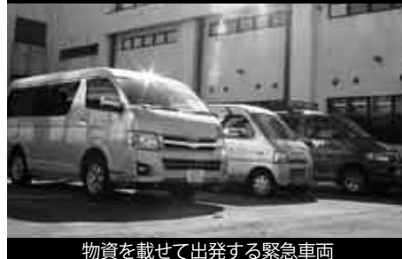
物資を載せて出発する緊急車両