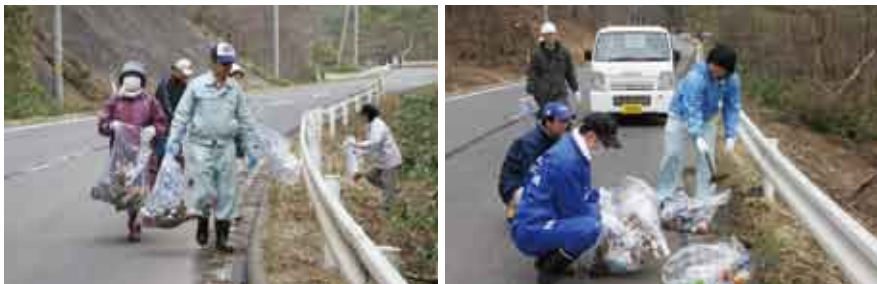
①役場駐車場で行われたクリーン九戸行動日の開会式。②参加者は県道一戸山形線や農道に分かれてゴミ拾いを行いました。