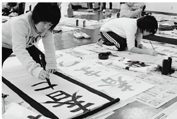
集中して書初めに臨む児童たち