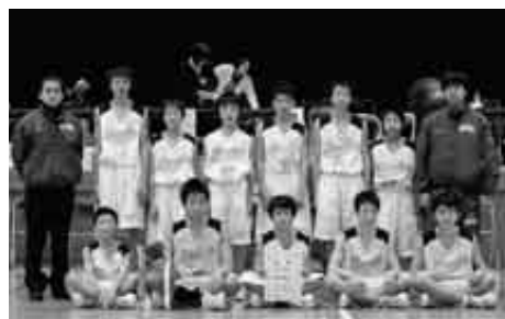
優勝に輝いた九戸中男子バスケット部

12月18日からの2日間、三戸町立三戸中学校体育館などを会場に、第10回三戸カップ（三戸町バスケットボール協会主催）が開催され、九戸中男子バスケット部が優勝を果たしました。大会には北東北地区から12校が出場。2月に開催される県選抜大会に向け、はつみをつけました。