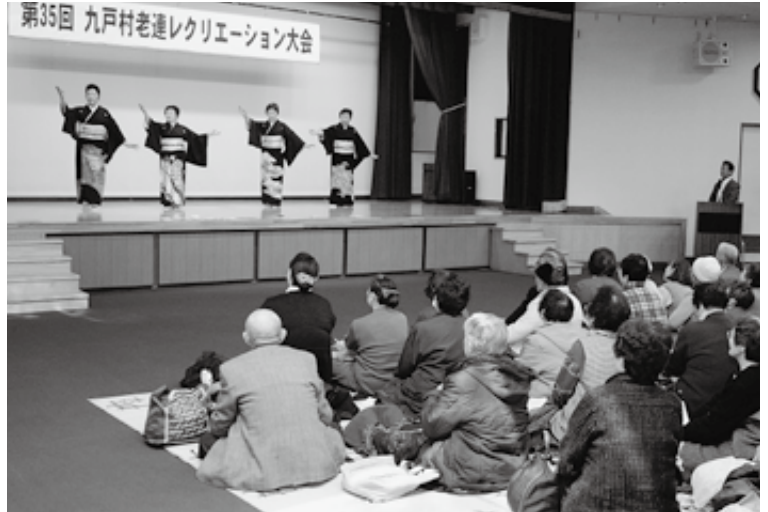
出演者は、演目に合わせた衣装をまとい、踊りや歌を披露しました

第35回九戸村老人クラブ連合会レクリエーション大会（村老連主催）は1月17日、HOZホールで開かれ、老人クラブ会員約150人が歌や踊りなどを楽しみました。