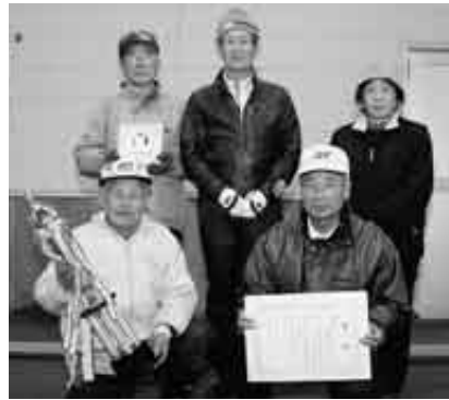
優勝した伊保内下チームの皆さん