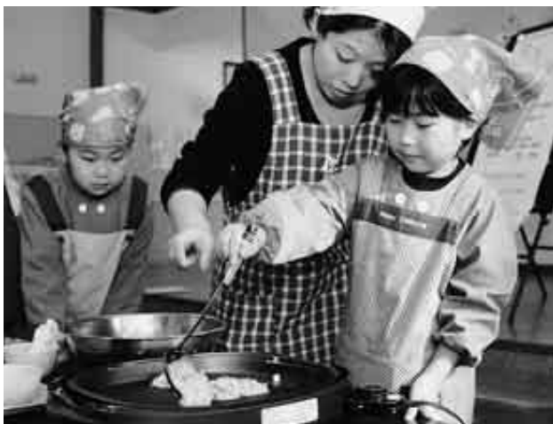
お母さんと一緒に、上手に生地を焼いていました