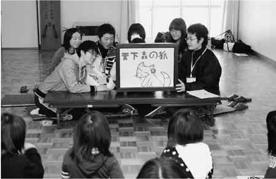
村の民話をもとに作成した紙芝居を披露する高校生（伊保内ふれあい会館）

第31回村地域子ども読書会（村教育委員会・伊保内高等学校主催）は1月6日から2日間、村内の自治公民館など20会場で開催されました。読書会には、伊保内高校1、2年生の有志59人が参加。生徒たちは各会場で、読み聞かせや遊びを通して地域の小学生との交流を楽しみました。