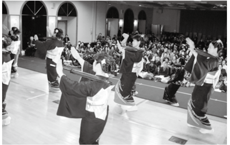
日本民謡協会岩手九戸支部の皆さんによる「南部荷方節」