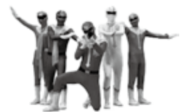
「近未来警察カシオペア」

コット「ぴかぼ」や「近未来警察カシオペア」のぬり絵を用意しています。参加してくれたお友達にはお土産も用意しています。