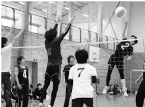
迫力のある接戦が繰り広げられた3部の試合

第13回九戸村ビーチボール大会は12月5日、体育センターで行われ、年齢や男女別に編成された19チームが3つの部門に分かれて熱