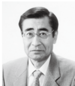
九戸村長 岩部 茂

平成23年の初頭にあたり謹んで新年のご喜び申し上げます。平素は村政へのご理解とご協力を賜り厚くお礼申し上げます。