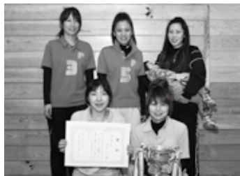
↑1部優勝 ガチャピン

九戸村ビーチボール協会では、毎週水曜日、夜7時からメンバーが体育センターに集まり、楽しみながら練習を行っています。年齢を問わず気軽にできる球技ですので、日頃運動不足を感じている方は一度協会の練習に足を運んで体験してみたいかがでしょうか。