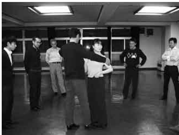
多様なジャンルのダンスに挑戦中です

んのご希望などを伺いながら今後の内容を企画していきたいと考えておりますので、挑戦してみたい講座などがありましたら、教育委員会生涯学習班（☎42・2111内線304）までご要望などをお寄せください。