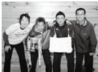
↑3部優勝 災害レスキュー隊2010