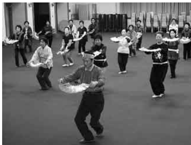
扇子を使って練習に励む舞踊教室の皆さん

岩部村長は「くのへスキー場は今年で30周年を迎えます。オープン当初に比べ、周辺の道路の整備などを含め、設備の充実に取り組んできました。村民の皆さんに、おおいに利用していただければと思います。」と話しました。