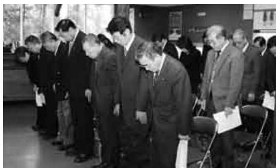
スキー場内の施設「ペチカ」で行われた安全祈願祭

村営くのへスキー場の安全祈願祭と開所式は12月14日に開催され、関係者など約30人がシーズン中の安全を願いました。