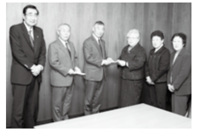
村長室でチャリティー収益金の贈呈が行われました

第25回歳末チャリティー演芸会(村地域婦人団体協議会主催)は11月28日、HOZホールで開催され、村内の婦人会や事業所などから、のべ19組が出演しました。この日のプログラムは、歌や踊りのほかにも、着付け教室の皆さんと子どもたちが華やかな着物で登場したり、村職員退職者会の皆さんによる「オドデ様の話」の紙芝居など、盛りだくさんの内容。来場者は、次々に発表される演目を楽しみながら大きな拍手を送っていました。チャリティーに寄せられた収益金は12月7日、福祉向上のためにと村社会福祉協議会と九戸福祉会に寄付されました。