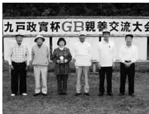
準優勝に輝いた伊保内下チームの皆さん