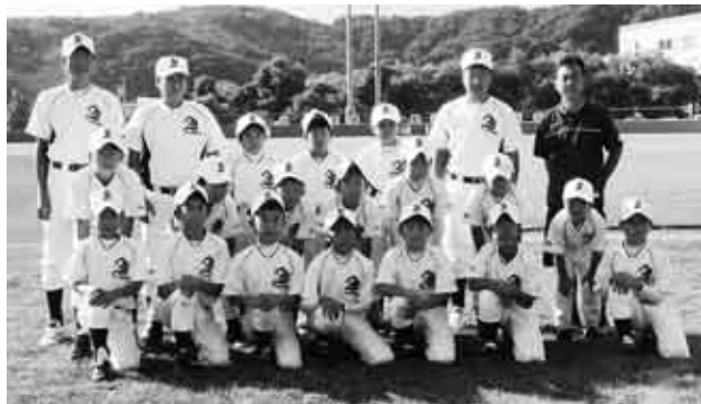
県学童軟式新人大会でベスト8入りした伊保内スポーツ少年団

岩手県野球協会長旗第9回学童軟式新人大会兼第8回東北学童軟式野球新人大会は9月4日から5日まで県内の球場で開かれました。大会には、各地区の予選を勝ち上がった29チームが出場して熱戦を展開。二戸郡代表として出場した伊保内スポーツ少年団はトーナメント戦で2勝し、ベスト8入りを果たしました。