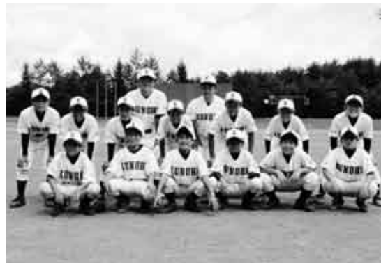
本選への出場権を獲得した九戸ジュニアクラブ