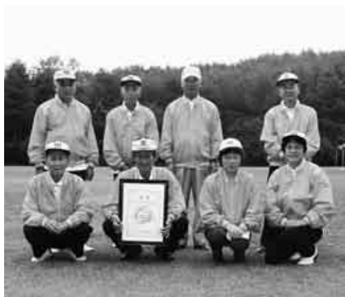
長寿体育祭ゲートボール交流大会で村勢初の優勝を飾った選手の皆さん

60歳以上の方が参加資格をもつ、岩手県民長寿体育祭(県などが主催)のゲートボール交流大会は9月4日、盛岡市で開催され、県内から集まった60チームが日ごろ鍛えた腕を競い合いました。リーグ戦の結果、全勝を果たし、得失点差で上回った九戸村チームが初優勝。来年秋に熊本県で開催される全国大会への出場権を獲得しました。