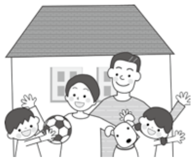
♪ 宗族で健康的な生活習慣を♪

子どもが肥満の場合、親も同じように太っていることが多く、その理由は家庭の食生活だけでなく運動習慣にもあります。食べてはゴロゴロ