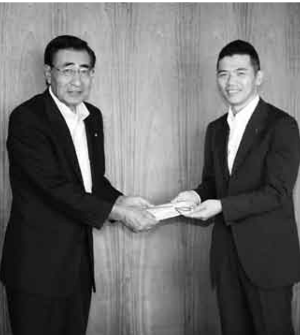
十文字社長から寄付目録を受け取る岩部村長