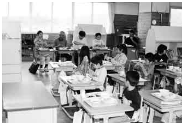
4人の方達と話をしながら、給食を食べる児童たち