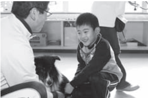
聴診器を当てて犬の心音を聴く児童