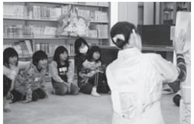
大型絵本「ねずみのでんしゃ」の読み聞かせ

この日は、児童・幼児6人と、保護者2人が参加。「やまびこ」のメンバーが『かさじぞう』の絵本を読んだり、紙芝居や大型絵本が始まると、子どもたちはその世界に釘付けとなっていました。読み聞かせの合間には、休憩を兼ねて歌ったり、ゲームで参加者同士が触れ合ったりと、笑い声があふれるにぎやかな読み聞かせ会となりました。