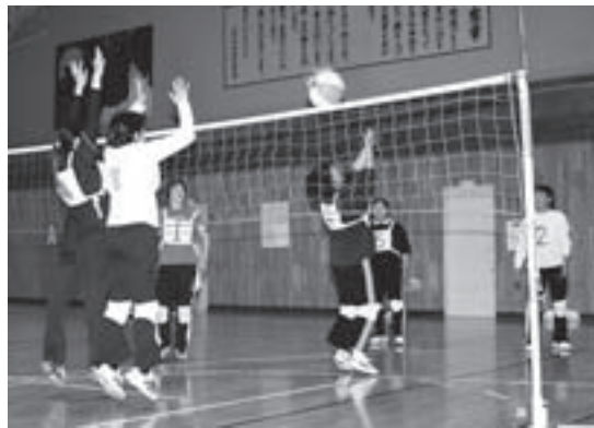
各部門で熱い試合が行われました