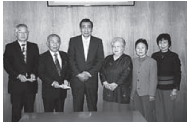
（左から）関口村福祉会長、上柿村社会福祉協議会長、岩部村長、収益金を寄附した村地域婦人団体協議会の皆さん

12月8日には、村婦協の皆さんが村長室を訪問。演芸会に寄せられた収益金を、福祉向上のためにと村社会福祉協議会と九戸福祉会に寄付しました。