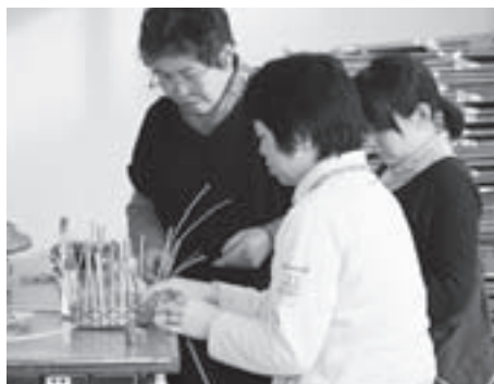
かごバックを製作したエコクラフト教室

今年度の「手作り・伝承塾」が12月11日の「裂き織り教室」を皮切りに始まり、8つの教室で学級生が作品作りに取り組んでいます。