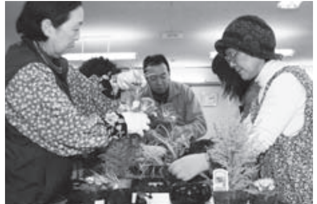
講師の指導を受けながら寄せ植えを作る受講生

12月21日、女性教室「室内観賞用花寄せ植え」が村山村開発センターで行われ、18人が室内観賞用の花の寄せ植えの作業を行いました。