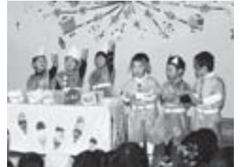
「お店ごっこ」ではアイスクリームのお買い物

満員のお客さんに、最初は少し緊張気味だった園児たち。年少組は上手なお片付け、3歳児はお気に入りの遊びのお店ごっこを披露し、普段の子どもたちの様子が目に浮かぶような発表でした。4歳児の劇では医者・警察官などかわいらしい衣装をまとった子どもたちが登場し、年長組は「おむすびころりん」を大きな声で堂々と演じました。そのほか、お遊戯や合奏、うたも披露。最後まで元気いっぱい発表する園児たちに、お客さんは笑顔で大きな拍手を送っていました。