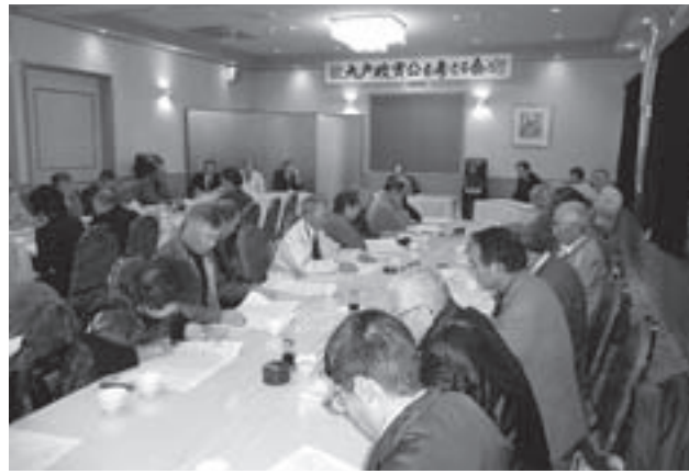
宮城県栗原市では栗駒の皆さんとの懇談会を開催

できない人物、九戸政實公と彼の生きた時代の社会情勢をテーマに、12月15日までの5回の講座が開かれました。