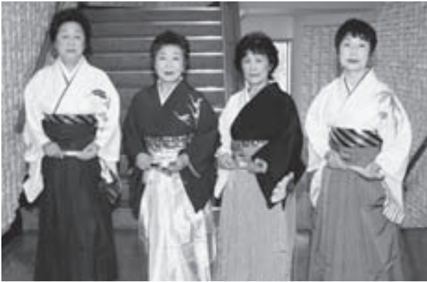
息の合った踊りでオープニングを飾った 伊保内婦人会・上町有志の皆さん