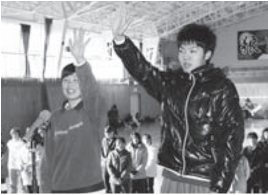
選手の士気を高めた高校生の選手宣誓