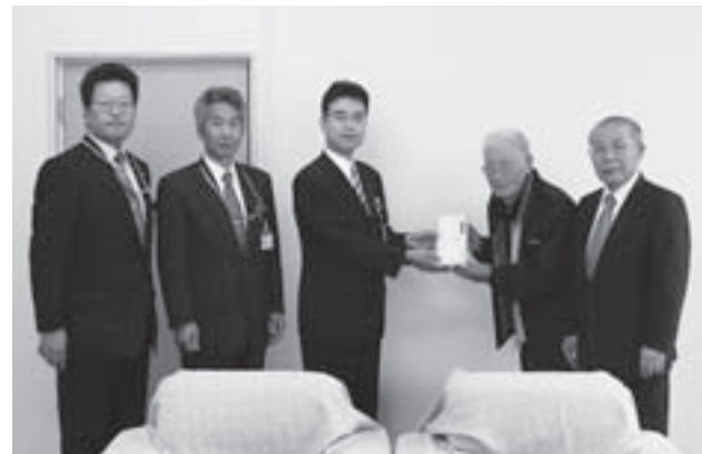
施設関係者にタオルを贈呈する郵便局長会九戸支部の皆さん