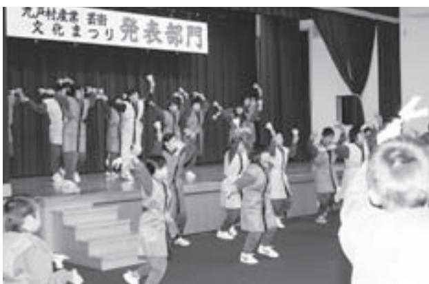
↓元気いっぱい踊りを披露する長興寺小の児童たち