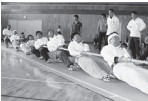
綱引き競技男子の部優勝・戸田1区

男女それぞれ6チームによるリーグ戦の結果、男子は戸田1区が前年度に続いて優勝を飾り、準優勝伊保内1区、3位伊保内2区。女子は伊保内1区が5年連続の優勝、準優勝江刺家、3位戸田1区という結果となりました。今回の綱引き競技の終了により、6競技8種目の競技を村内6地区の体育振興会の対抗戦で繰り広げられた。