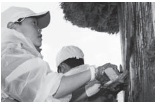
かやぶき小屋の壁塗りをを行う戸田小学校の児童

第23回村産業・芸術文化まつりは10月31日から11月3日までの4日間、HOZホールと山村開発センターで発表部門と展示部門、村体育センターで産業部門が開催されました。