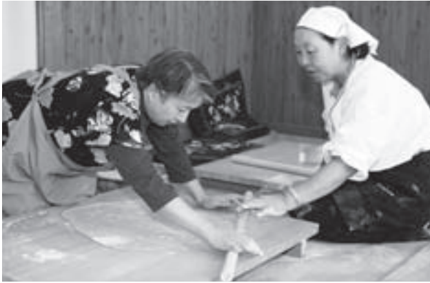
新そば打ちの体験会の様子

村観光協会主催の新そばまつりは10月24日、25日の2日間、道の駅おりつめ「オドデ館」で開催され、村内外からの来場者で賑わいました。