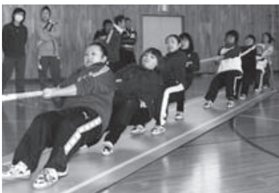
綱引き競技女子の部優勝・伊保内1区

今年度の村民体育大会は、伊保内1区が0・5ポイント差で江刺家を抑え、9年連続となる総合優勝を果たしました。各体育振興会の種目ごとの得点は、次のとおりです。