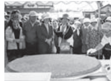
世界一のジャンボ南部せんべい

新そばはもちろん、地元産の焼き鳥や、田楽も好評な売れ行き。来場者は清々しい秋空の下で、九戸の秋の味覚を堪能しました。