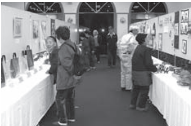
↑ホールに並んだ展示作品を鑑賞する来場者