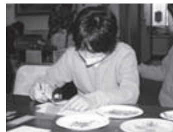
押し花体験ではしおりを制作

第23回村産業・芸術文化まつりは10月31日から11月3日までの4日間、HOZホールと山村開発センターで発表部門と展示部門、村体育センターで産業部門が開催されました。