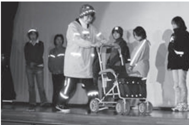
交通安全母の会による、夜光反射材を使ったファッションショー

10月28日、村公民館H O Zホールで第36回二戸地方交通安全大会が開かれ、関係者約150人が出席しました。