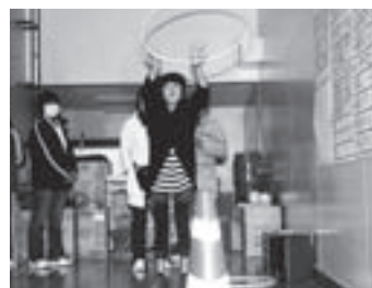
商品券がもらえる輪投げ大会

村体育センターでは2日間、村内の26の企業や団体が出店したほか、豪華景品が当たるビンゴゲームなどのイベントを開催。買い物客やイベント参加者で、会場は賑わいました。