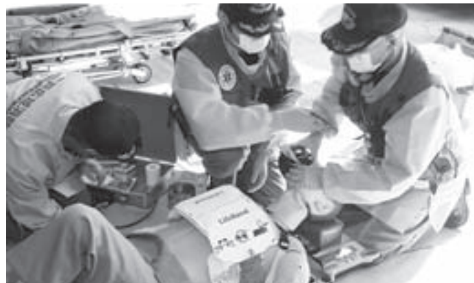
①訓練 オートパルスを使った救命活動の様子

9月13日、二戸消防署九戸分署に自動心臓マッサージ器「オートパルス」1台が導入されました。この機械は、患者の体格などを自動で検知し、マジックテープ式のバンドが胸郭全体を圧迫してマッサージするもの。患者を担架で搬送する間、絶え間なく心臓マッサージを行うことが可能となります。