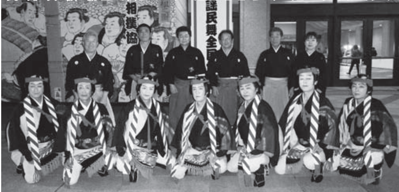
◎「南部馬方三下り」出演者◎（敬称略）