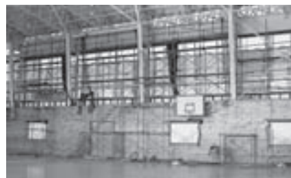
増築工事中の体育センター

村体育センターは、増築工事施工のため、来年3月までご利用を中止させていただいております。4月からは新しくトレーニング・ルームとミーティング・ルームを備えた