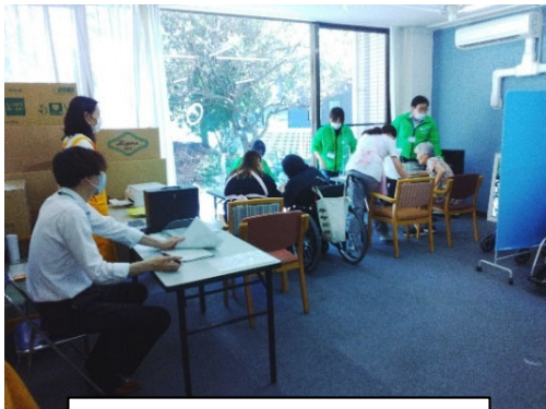
出張申請受付の様子