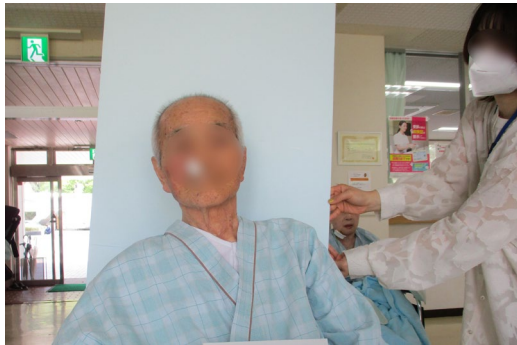
出張申請受付（顔写真撮影）の様子