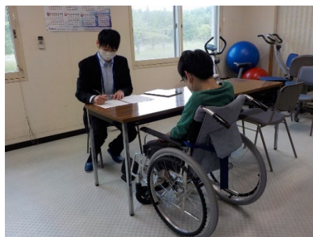
出張申請受付の様子