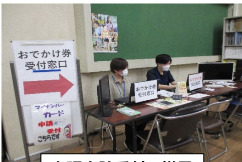
出張申請受付の様子