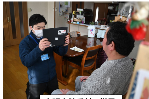
出張申請受付の様子