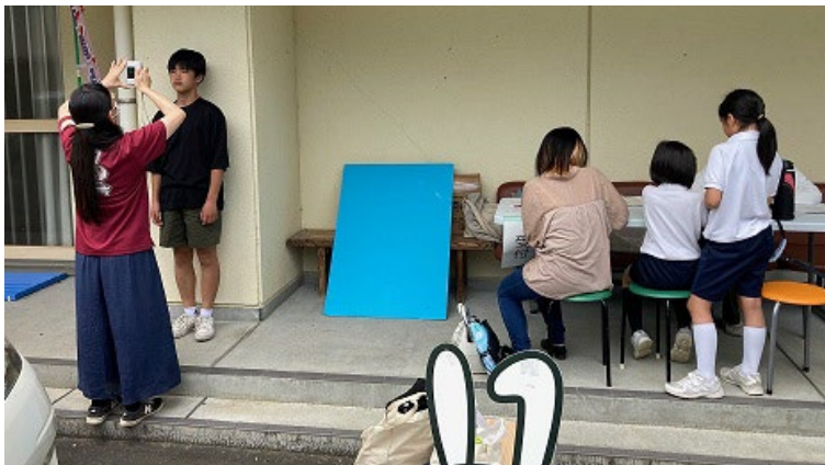
運動会での申請受付ブース