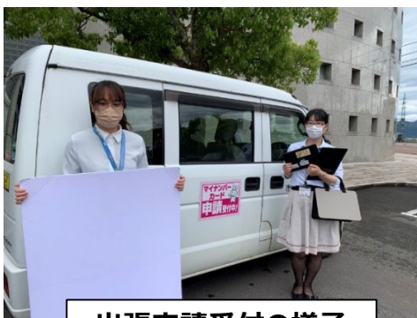
出張申請受付の様子