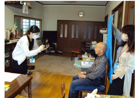
出張申請受付の様子