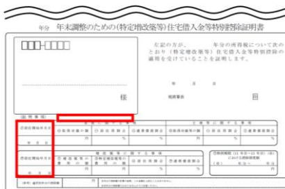
【居住開始が平成 31 年1月1日以後の場合】