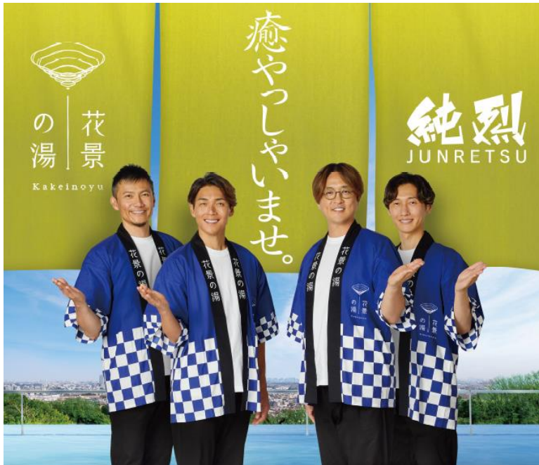
貸出画像「花景の湯 フォトスポット(イメージ)」

“スーパー銭湯アイドル”の純烈と共に益々盛り上がるHANA・BIYORIと花景の湯にどうぞご期待ください。