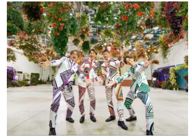
貸出画像「HANA・BIYORI フォトスポット(イメージ)」