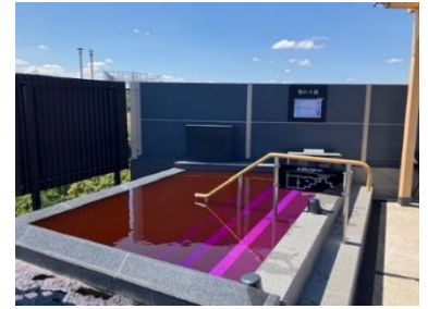
貸出画像「純烈の湯(イメージ)」