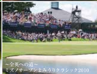
～全英への道～ ミスノオープンよみうりクラシック2010