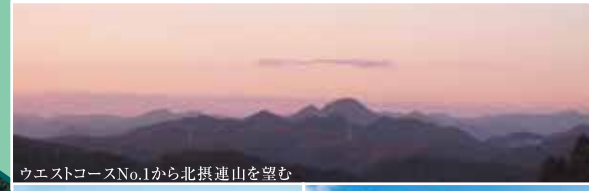
ウエストコースNo.1から北摂連山を望む