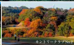
カントリークラブNo.2