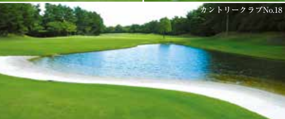
カントリークラブNo.18