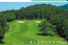
カントリークラブNo.5