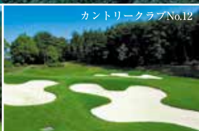
カントリークラブNo.12