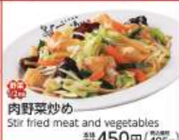
肉野菜炒め Stir fried meat and vegetables 価格 450円 (税込495円)