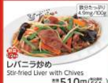
レバニラ炒め Stir-fried Liver with Chives 価格 510円 (税込561円)