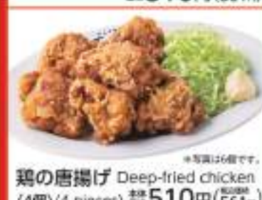
鶏の唐揚げ Deep-fried chicken (4個) (4 pieces) 価格 510円 (税込561円) (6個) (6 pieces) 価格 750円 (税込825円)