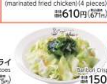
パリパリ きゃべつ Banchori Crispy Cabbages 価格 150円 (税込165円)