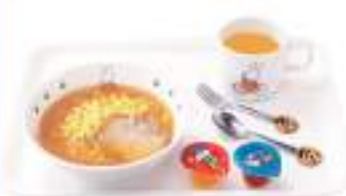
おこさまラーメンセット Kids' ramen set

本体 200円 (税込220円) しょうゆラーメン / ドリンク(オレンジ) / ゼリー2個