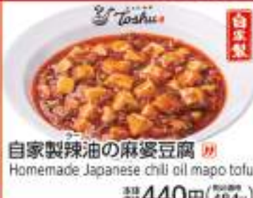
自家製辣油の麻婆豆腐 Homemade Japanese chili oil mago tofu 価格 440円 (税込484円)