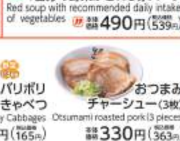
おつまみ チャーシュー(3枚) Osumami roasted pork (3 pieces) 価格 330円 (税込363円)