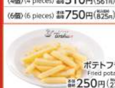
ポテトフライ Fried potatoes 価格 250円 (税込275円)