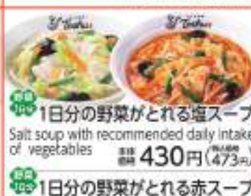
1日分の野菜がとれる塩スープ Salt soup with recommended daily intake of vegetables 価格 430円 (税込473円)