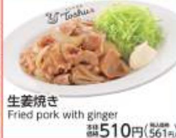
生姜焼き Fried pork with ginger 価格 510円 (税込561円)