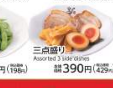
三点盛り Assorted 3 side dishes 価格 390円 (税込429円)