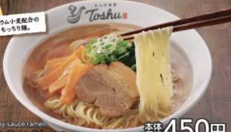
Soy sauce ramen