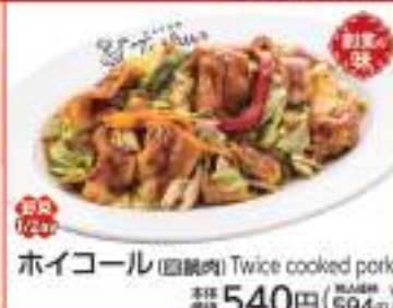
ホイコール(豚焼肉) Twice cooked pork 価格 540円 (税込594円)