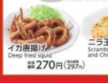
イカ唐揚げ Deep fried squid 価格 270円 (税込297円)