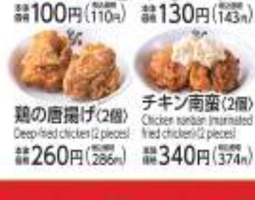
鶏の唐揚げ(2個) Deep-fried chicken (2 pieces) 価格 260円 (税込286円) チキン南蛮(2個) Chicken nanban (marinated fried chicken) (2 pieces) 価格 340円 (税込374円)

ライス単品 普通 価格 170円 (税込187円) 大盛り 価格 240円 (税込264円) 少なめ 価格 120円 (税込132円)