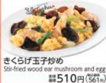
きくらげ玉子炒め Stir-fried wood ear mushroom and egg 価格 510円 (税込561円)