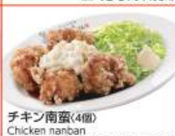
チキン南蛮(4個) Chicken nanban (marinated fried chicken) (4 pieces) 価格 610円 (税込671円)