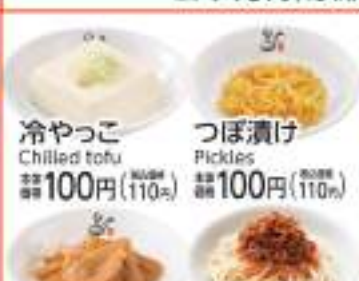
冷やっこ Chilled tofu 価格 100円 (税込110円) つぼ漬け Pickles 価格 100円 (税込110円)