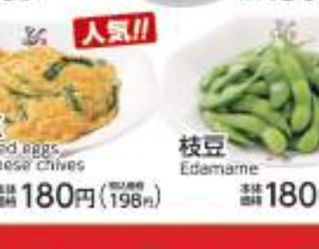
ニラ玉 Scrambled eggs and Chinese chives 価格 180円 (税込198円)