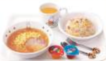
おこさまチャーハンセット Kids' fried rice set

本体 200円 (税込220円) しょうゆラーメン / ドリンク(オレンジ) / ゼリー2個