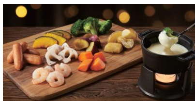
「クリスマスチーズフォンデュ」 本体価格： 1,460円 税込価格： 1,576円