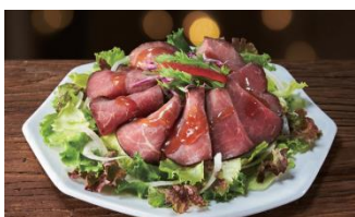
「クリスマス ローストビーフのサラダ」 本体価格： 1,280円 税込価格： 1,382円