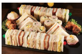
「パーティーサンド」 本体価格： 1,980円 税込価格： 2,138円