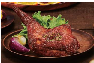
「国産ローストチキンレッグ」1本 本体価格： 980円 税込価格： 1,058円