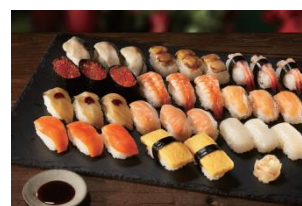
「にぎり寿司詰合せ32貫」 本体価格： 2,168円 税込価格： 2,341円

他にも、様々なケーキやフーズ、お酒の予約を承ります。詳しくは、店頭カタログをご覧ください。