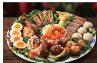
「クリスマス中華オードブル」 本体価格： 3,500円 税込価格： 3,780円