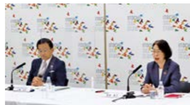
サステナビリティ説明会(働き方の進化を通じた企業価値の向上)