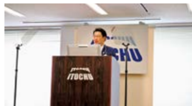
アナリスト・機関投資家向け決算説明会

* 2020年度は、新型コロナウイルス感染拡大防止のため、規模を縮小して開催しました。