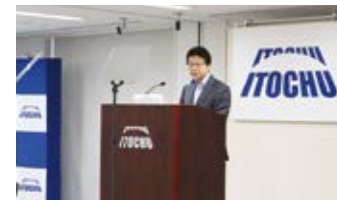
アナリスト・機関投資家向け決算説明会