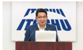
分野別説明会(電力・環境ソリューション部門)