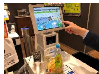
③出口のディスプレイで購入商品を確認して決済