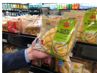
②商品は手持ちのバッグに入れても OK