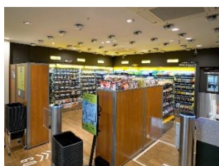
①入店後、欲しい商品を手取る

商品を手に取り、出口でディスプレイの表示内容を確認し、支払いするだけでお買い物が完了します。