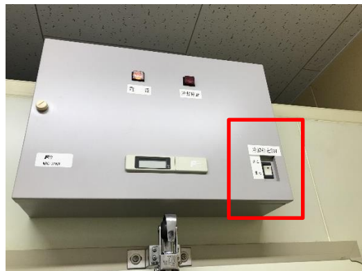
冷却機能電源スイッチ