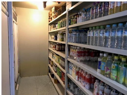
飲料用冷蔵庫内イメージ