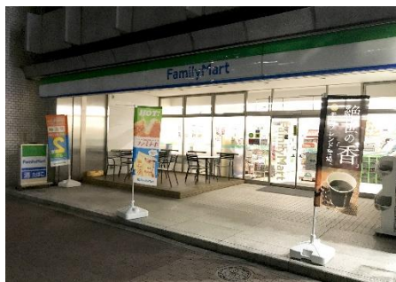
店頭看板を消灯した店舗イメージ

対象店舗 : 繁華街などに立地する一部店舗 ※店舗設備、環境により未実施の店舗もございます。