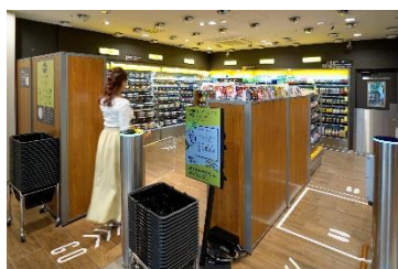
①店舗に入店 ※事前に手続きは必要ありません

商品を手に取り、出口でタッチパネルの表示内容を確認し、支払いするだけでお買い物が完了します。