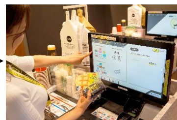
③出口のディスプレイで購入商品を確認して決済