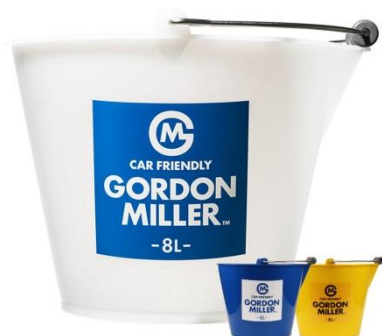
GORDON MILLER バケツ 8L ※イエロー／ブルーについては 7月下旬発売予定 各 699円