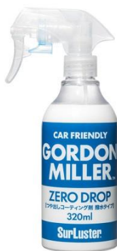
GORDON MILLER ZERO DROP 320ml 2,299円