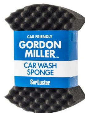
GORDON MILLER CAR WASH SPONGE 399円